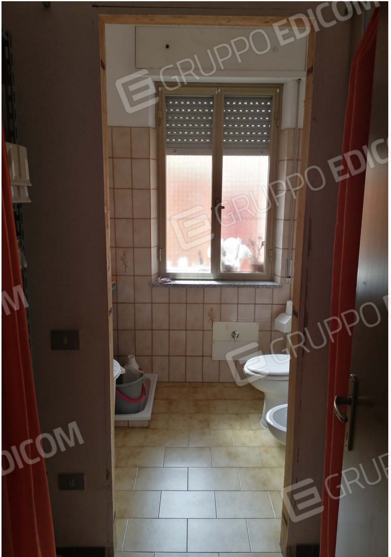
Foto 18: Vista sui servizi igienici bagno e antibagno dell'unità sub. 5.