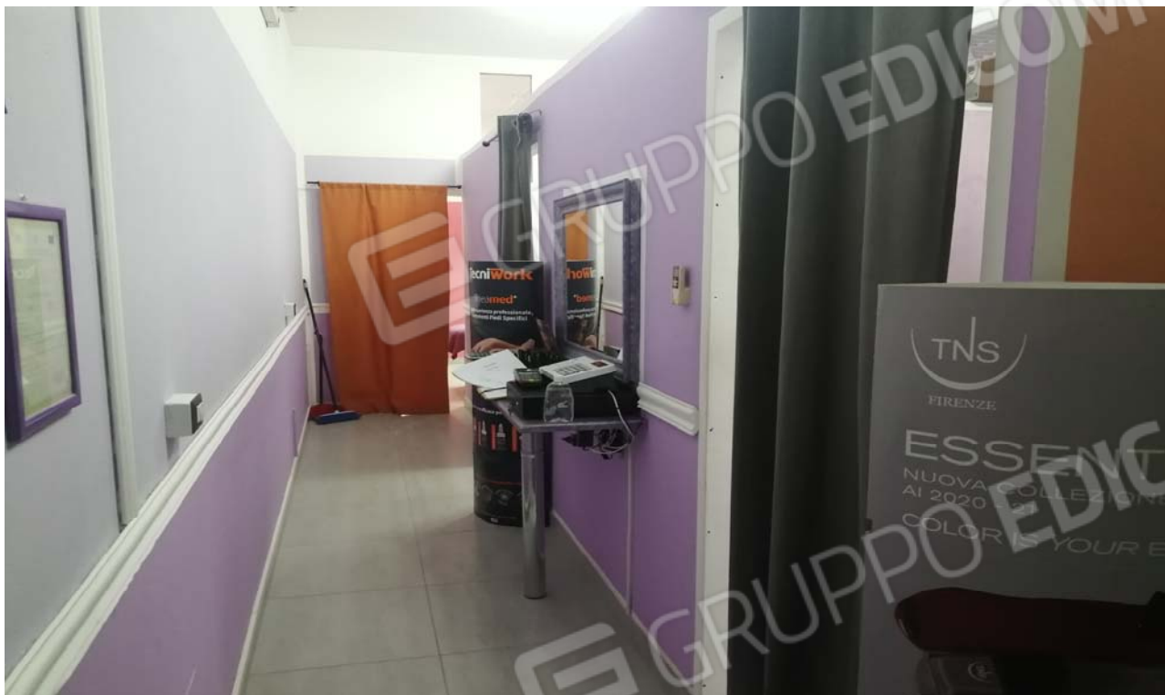
Foto 9: Particolare del corridoio dell'unità immobiliare adibita a d arti e mestieri sub. 5.