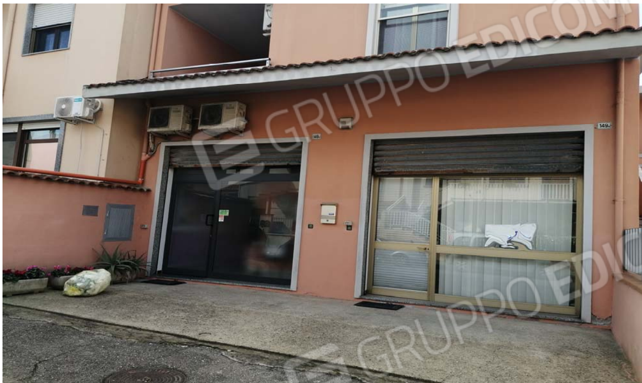
Foto 7: Particolare sull'accesso ai due locali ad uso laboratori per arti e mestieri a dx l'unità sub. 4 e a sx l'unità sub. 5.