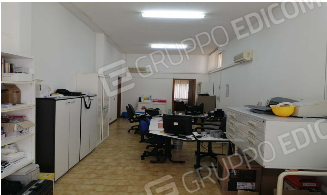
Foto 3: Vista dei locali adibiti a laboratorio per arti e mestieri unità sub. 4.