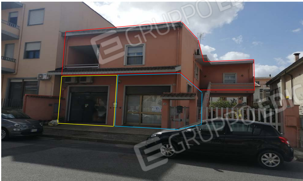
Foto 1: Vista d'insieme dell'immobile oggetto di pignoramento. Al piano terra i due locali adibiti laboratorio per arti e mestieri, ed al piano primo l'unità immobiliare ad uso abitativo.