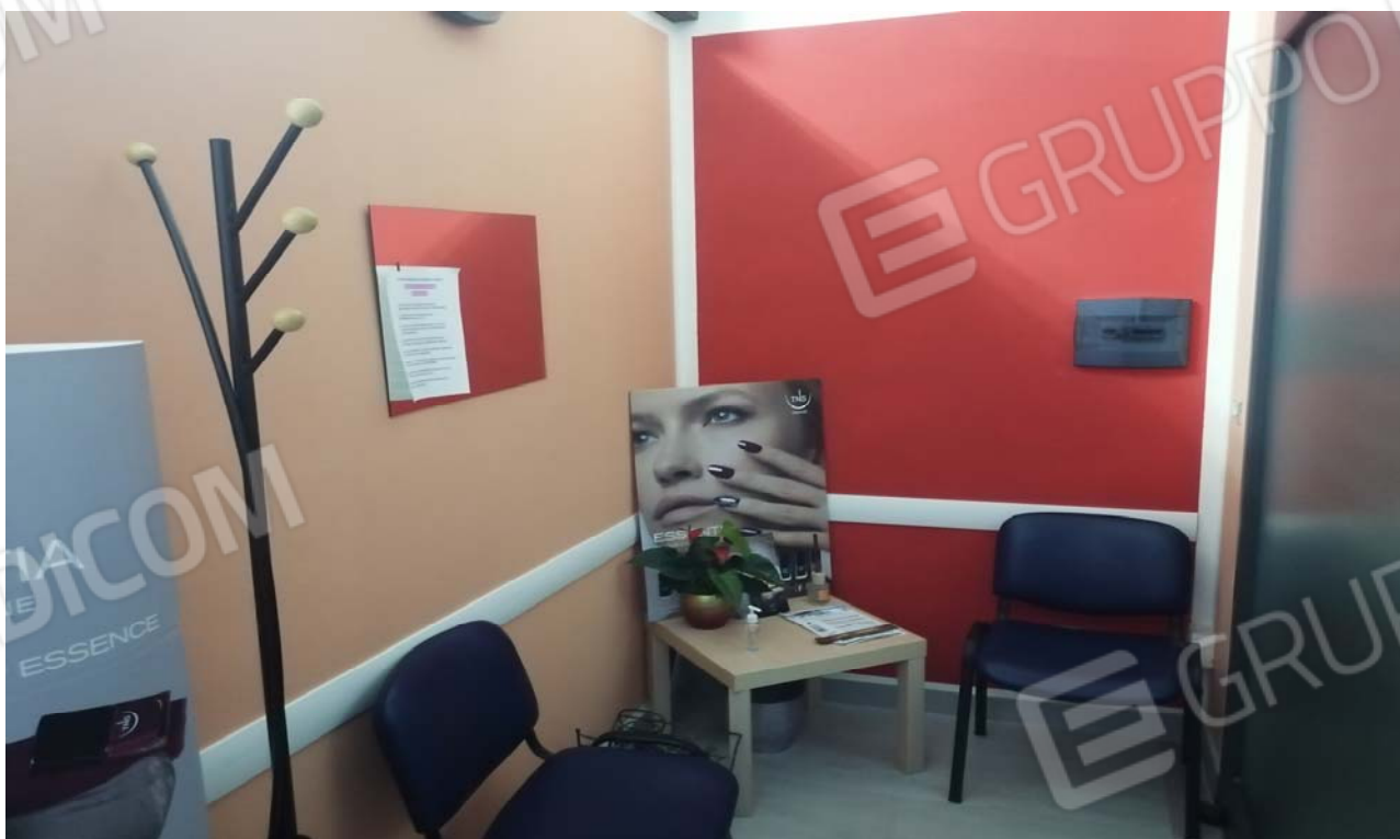
Foto 8: Particolare degli interni laboratorio per arti e mestieri dell'unità sub. 5 – ingresso/sala d'attesa.