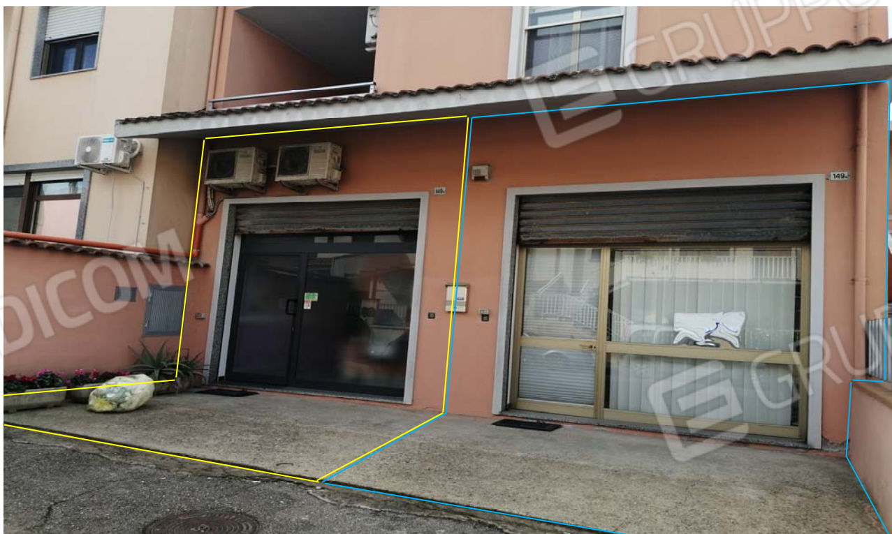
Foto 2: Particolare sull'accesso ai due locali ad uso laboratori per arti e mestieri a dx l'unità sub. 4 e a sx l'unità sub. 5.