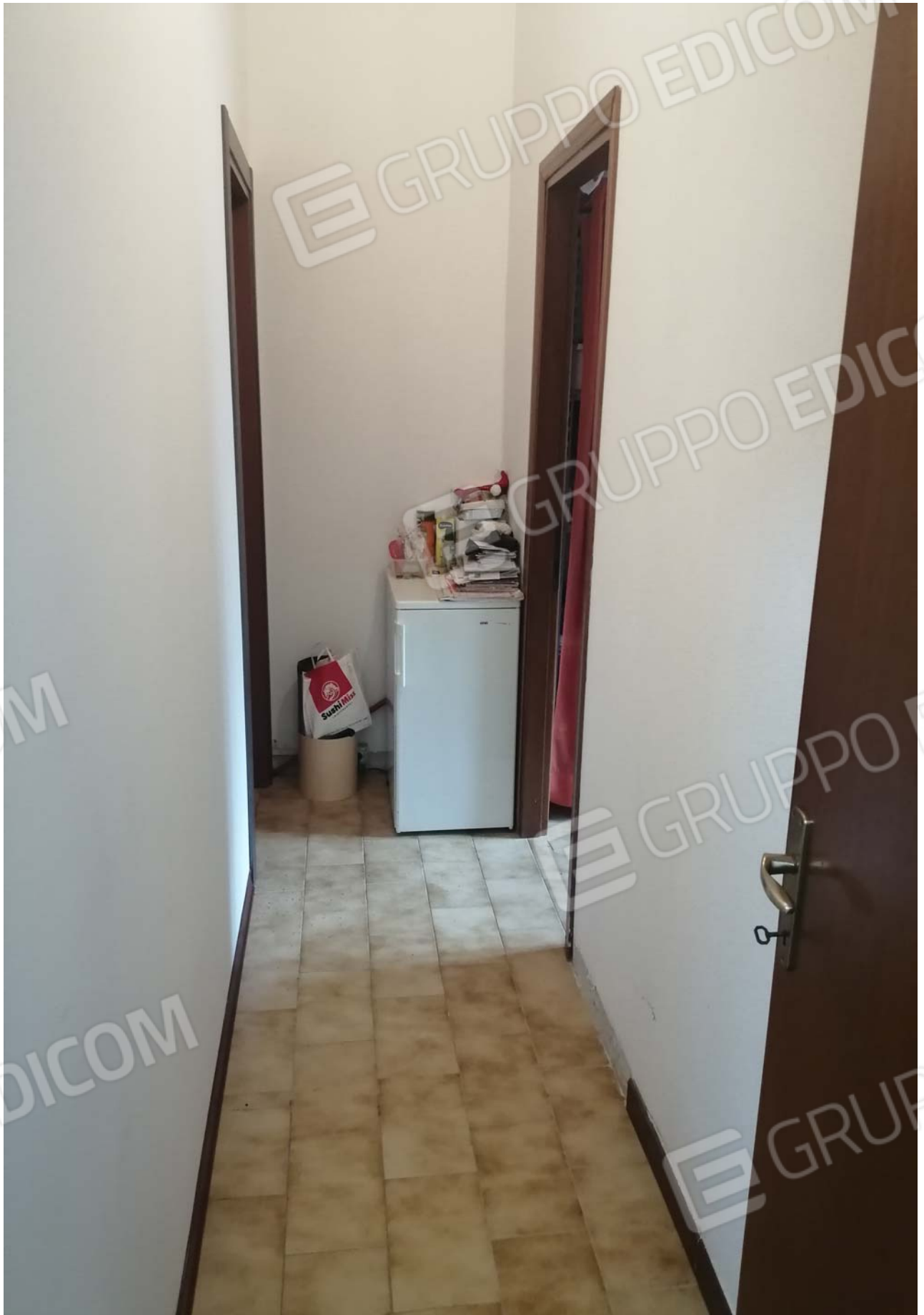
Foto 17: Particolare sul corridoio che disimpegna sui servizi igienici dell'unità sub 5.