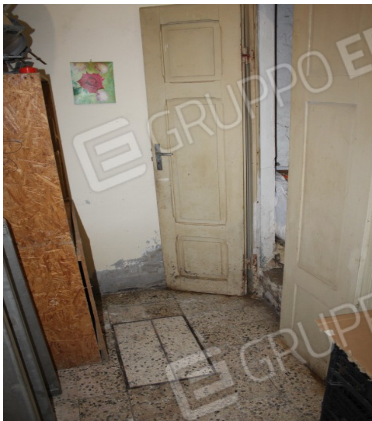
porzione di terrazzo piano primo