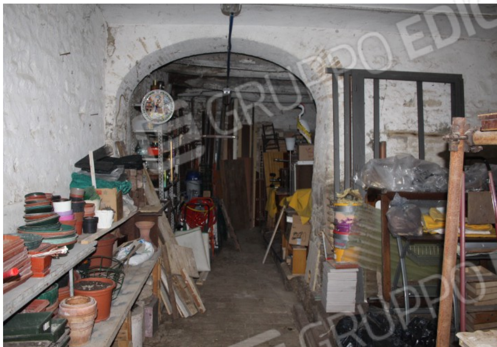
cantina piano terra