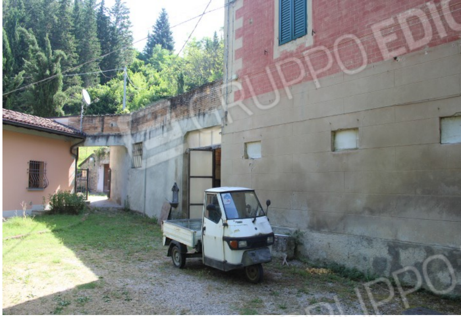
vista sul fianco del fabbricato