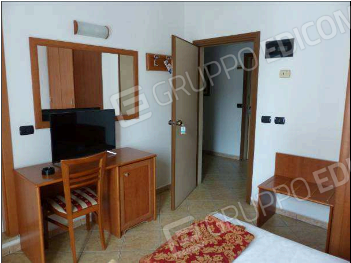
FOTO 19 – Piano secondo: camera tipo dell'albergo "Hotel ████████".