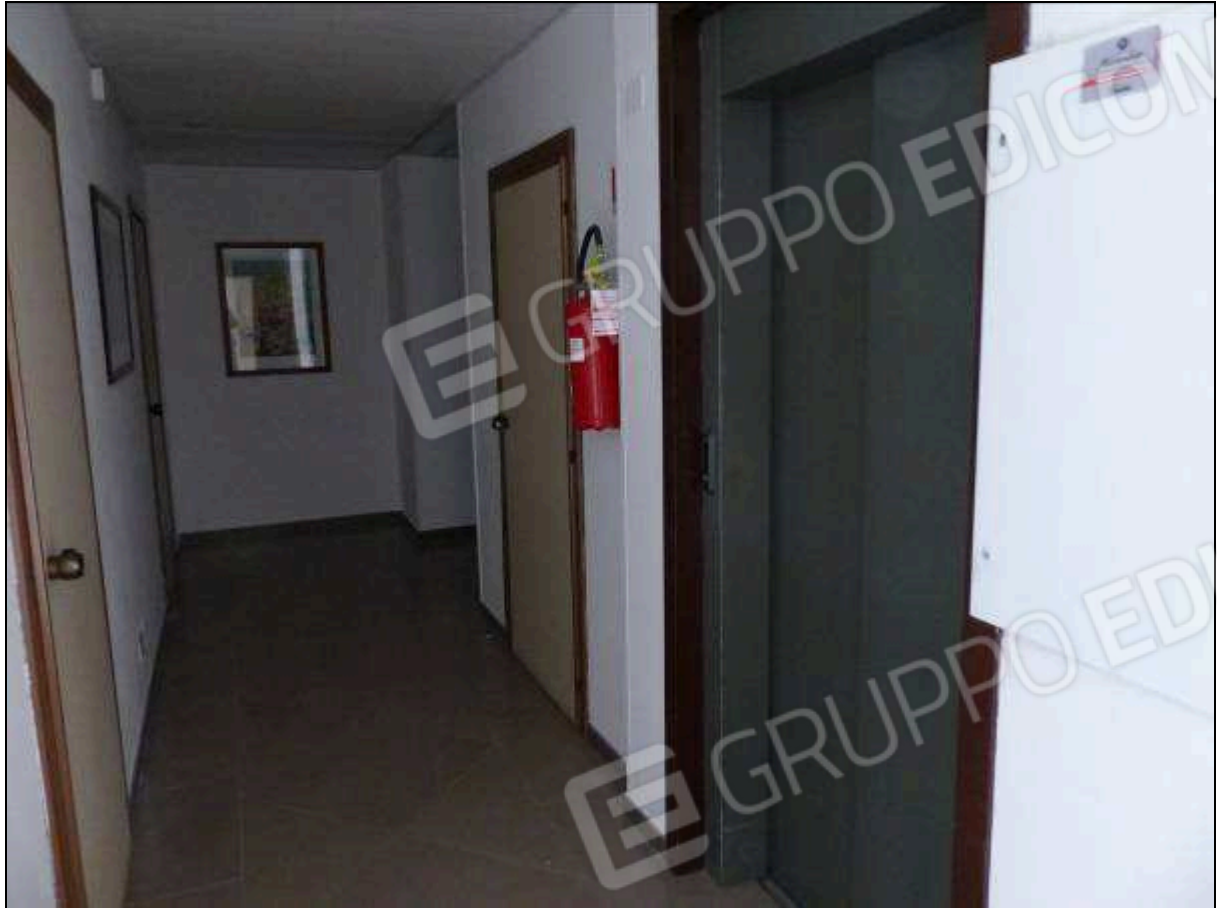
FOTO 28 – Piano sottotetto: corridoio di disimpegno dell'albergo "Hotel ████████".