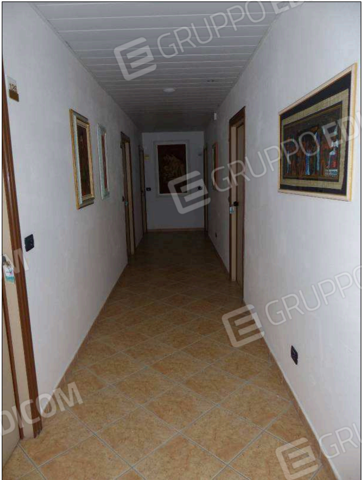
FOTO 18 – Piano primo: corridoio di disimpegno dell'albergo "Hotel [REDACTED]".