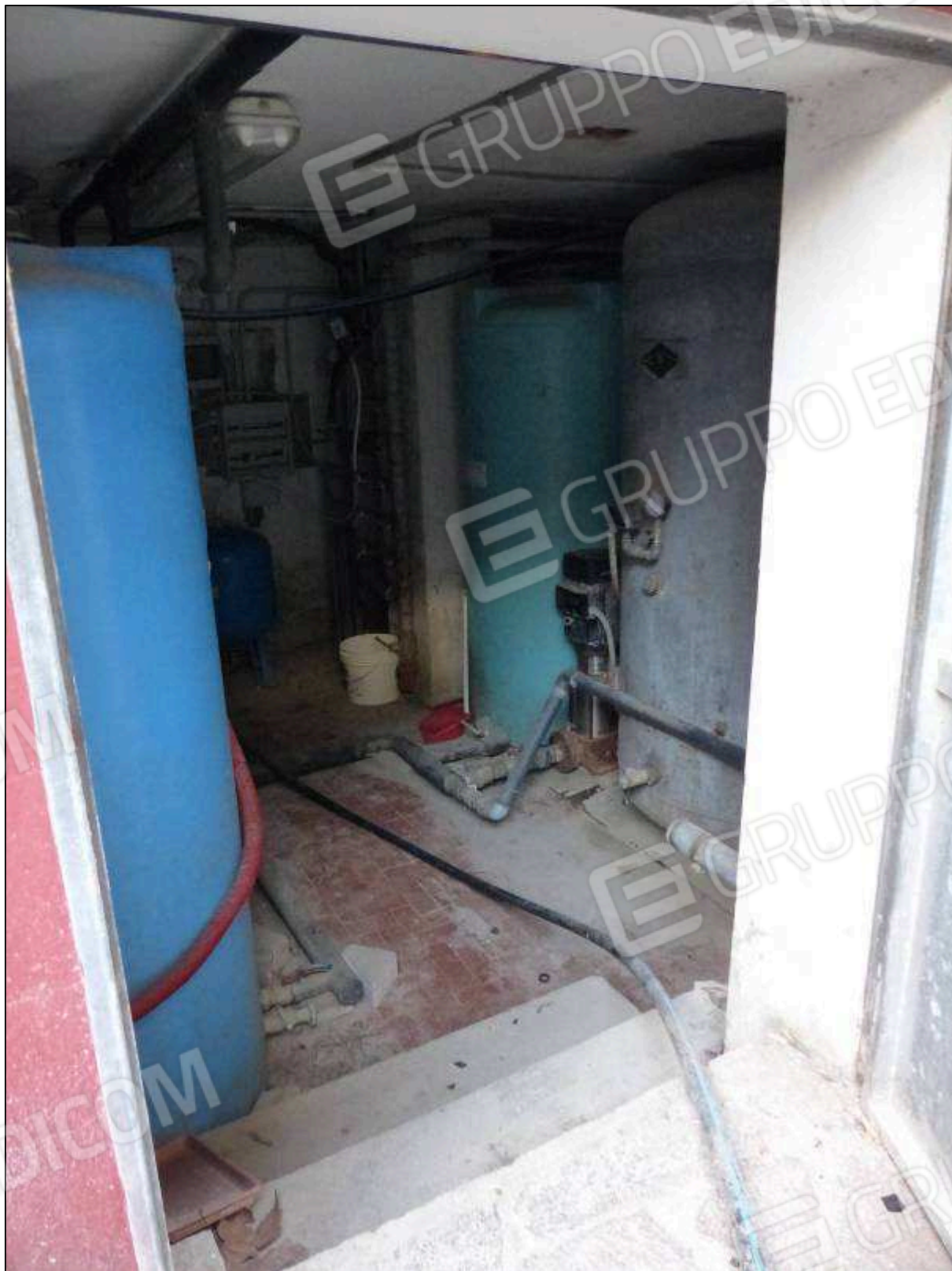
FOTO 87 - Piano terra: impianti idraulici, a servizio dei due alberghi, ubicati in altra proprietà.