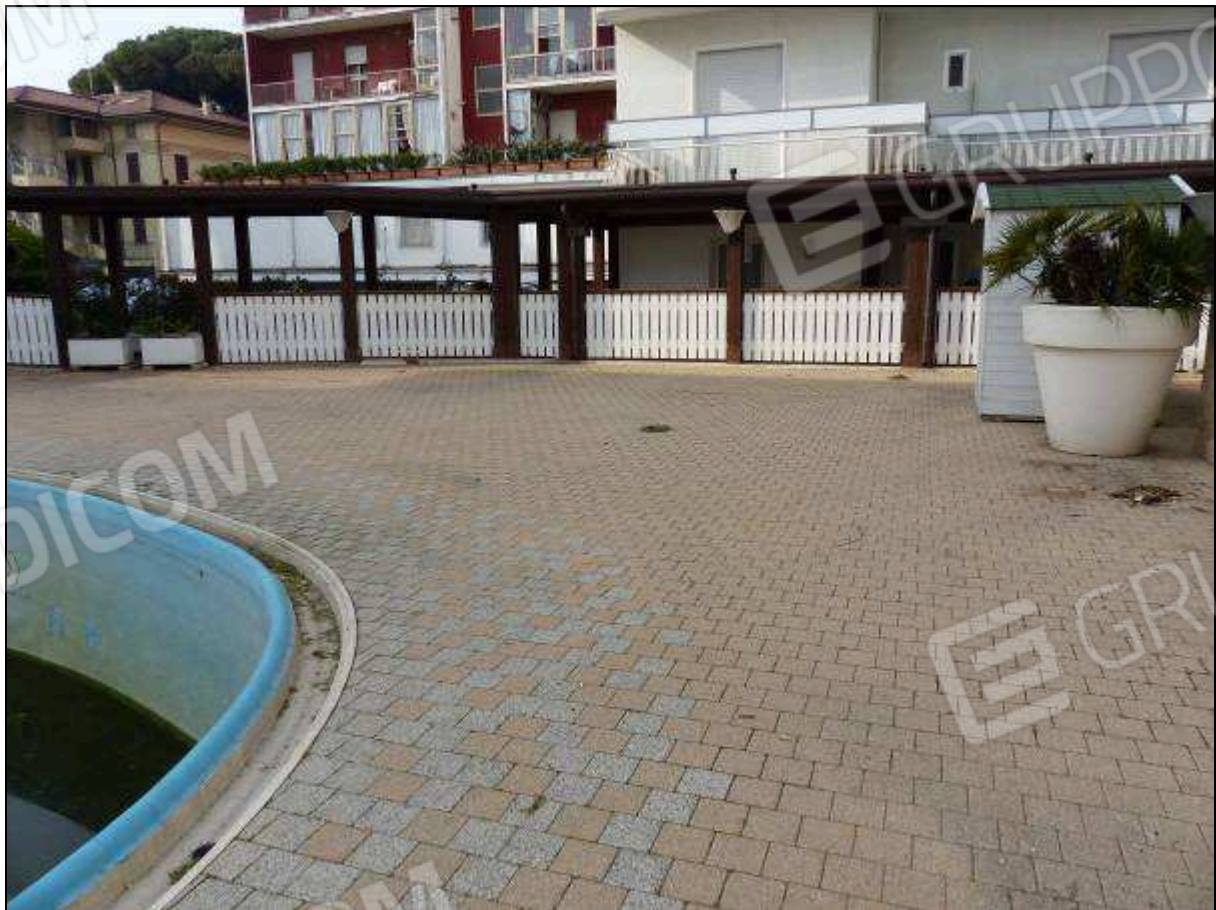
FOTO 40 – Piano terra: portico (lato monte) di collegamento tra gli alberghi “Hotel ██████” e “Hotel ██████”.