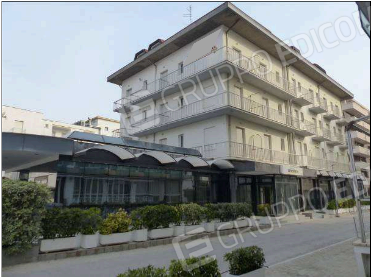
FOTO 1 – Prospetto principale (su Via Pirano) dell'albergo "Hotel [redacted]".