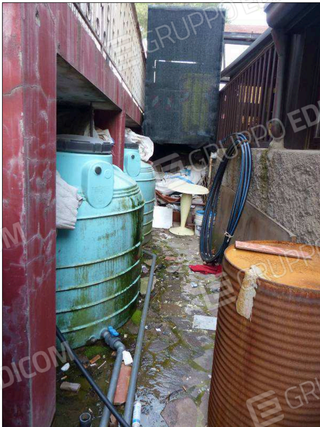
FOTO 86 – Piano terra: impianti idraulici, a servizio dei due alberghi, ubicati in altra proprietà.