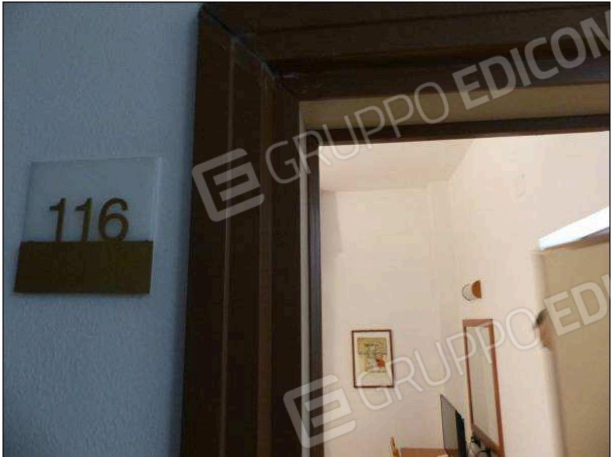
FOTO 13 – Piano primo: entrata camera tipo dell'albergo "Hotel ████████".