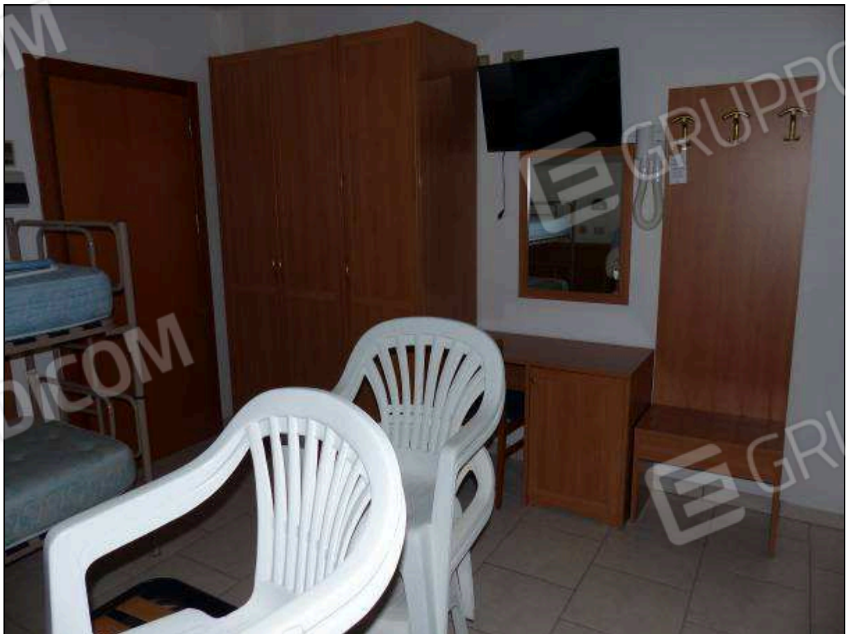
FOTO 70 - Piano secondo: camera tipo dell'albergo "Hotel [REDACTED]".