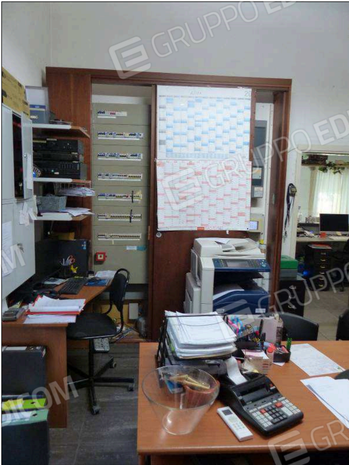
FOTO 8 – Piano terra: centralina nell'ufficio di direzione dell'albergo "Hotel [REDACTED]".