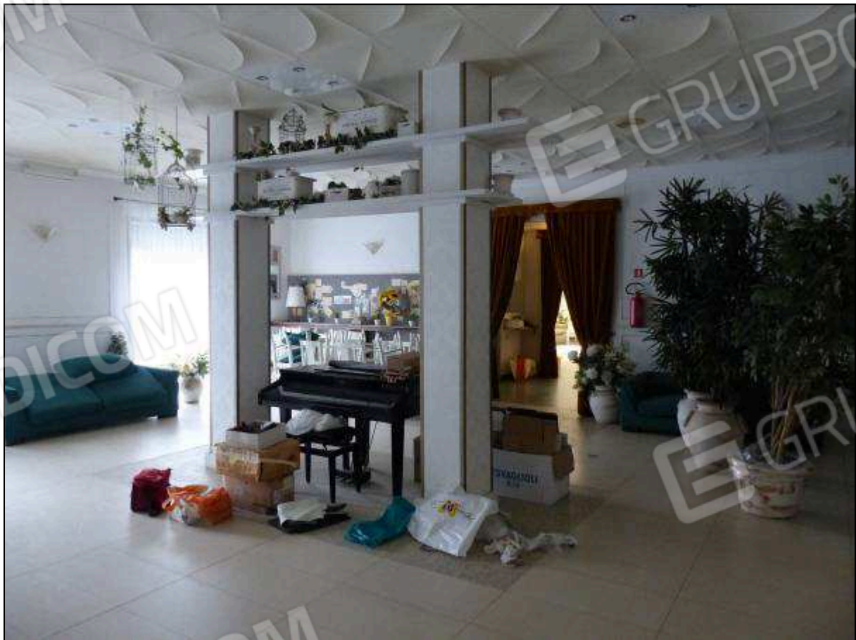
FOTO 11 - Piano terra: sala da pranzo dell'albergo "Hotel ████████".