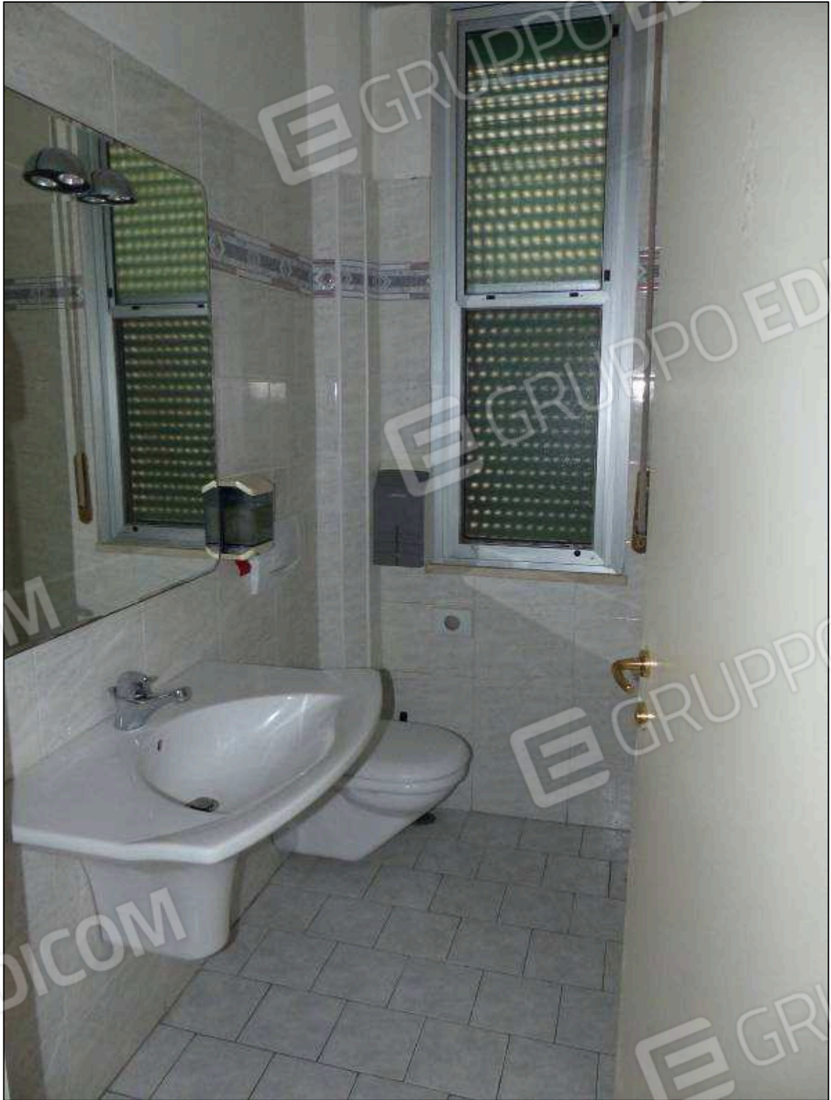
FOTO 9 – Piano terra: bagni comuni dell'albergo "Hotel [REDACTED]".