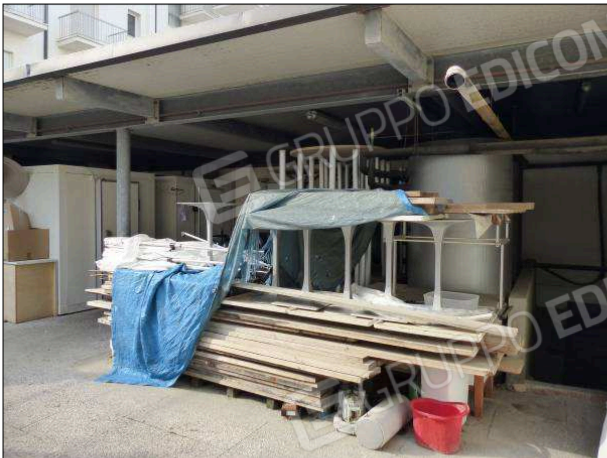
FOTO 43 – Piano terra: portico metallico (privo di titoli edilizi) di copertura degli impianti dell'“Hotel ██████████”.