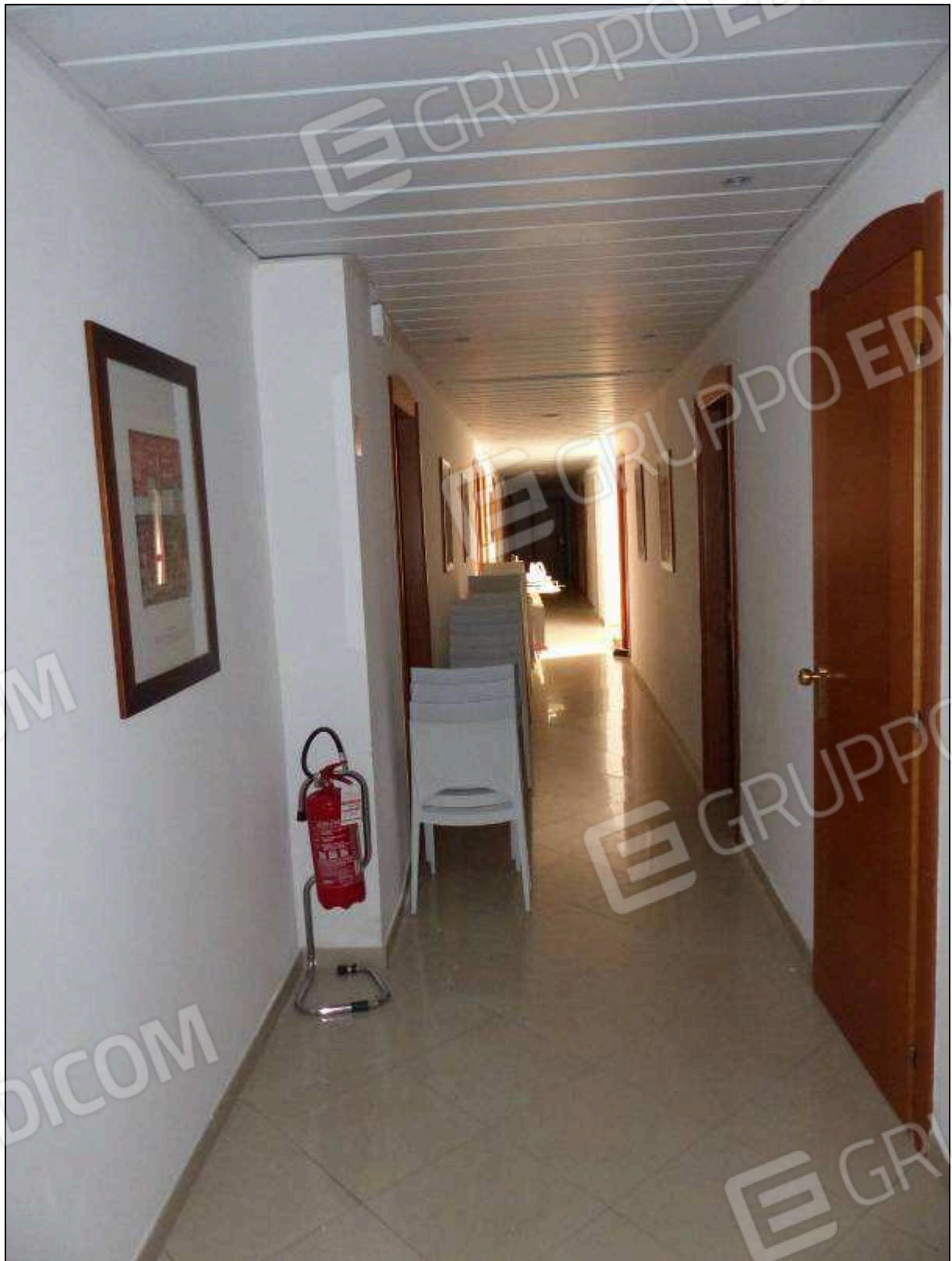
FOTO 65 - Piano primo: corridoio di disimpegno dell'albergo "Hotel [REDACTED]".