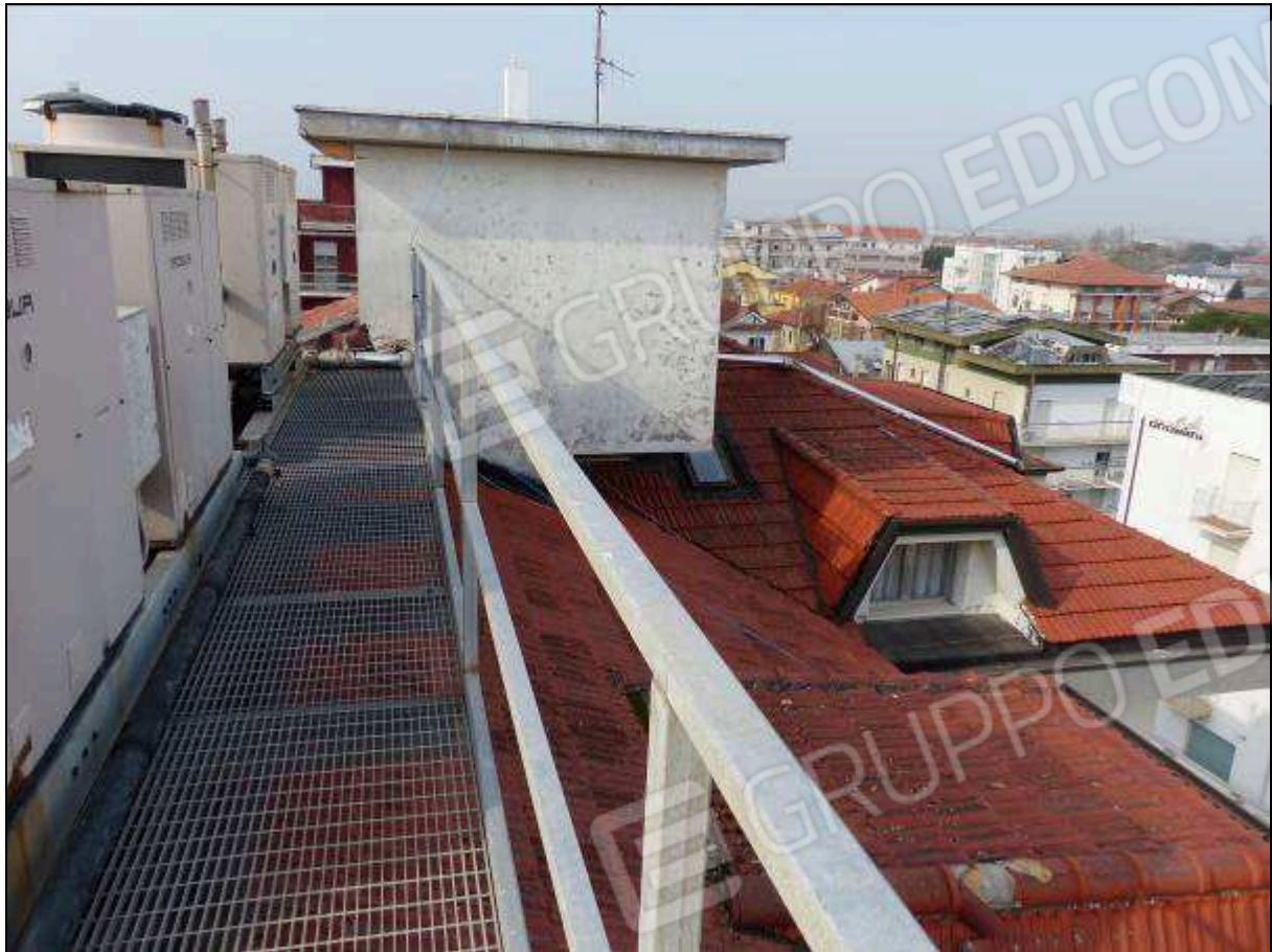
FOTO 34 – Piano copertura: camminamento per ispezione degli impianti dell'albergo "Hotel ████████".