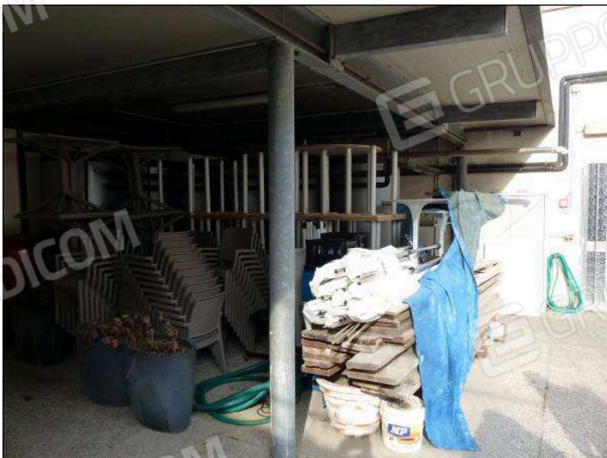
FOTO 44 - Piano terra: portico metallico (privo di titoli edilizi) di copertura degli impianti dell'“Hotel ██████████”.