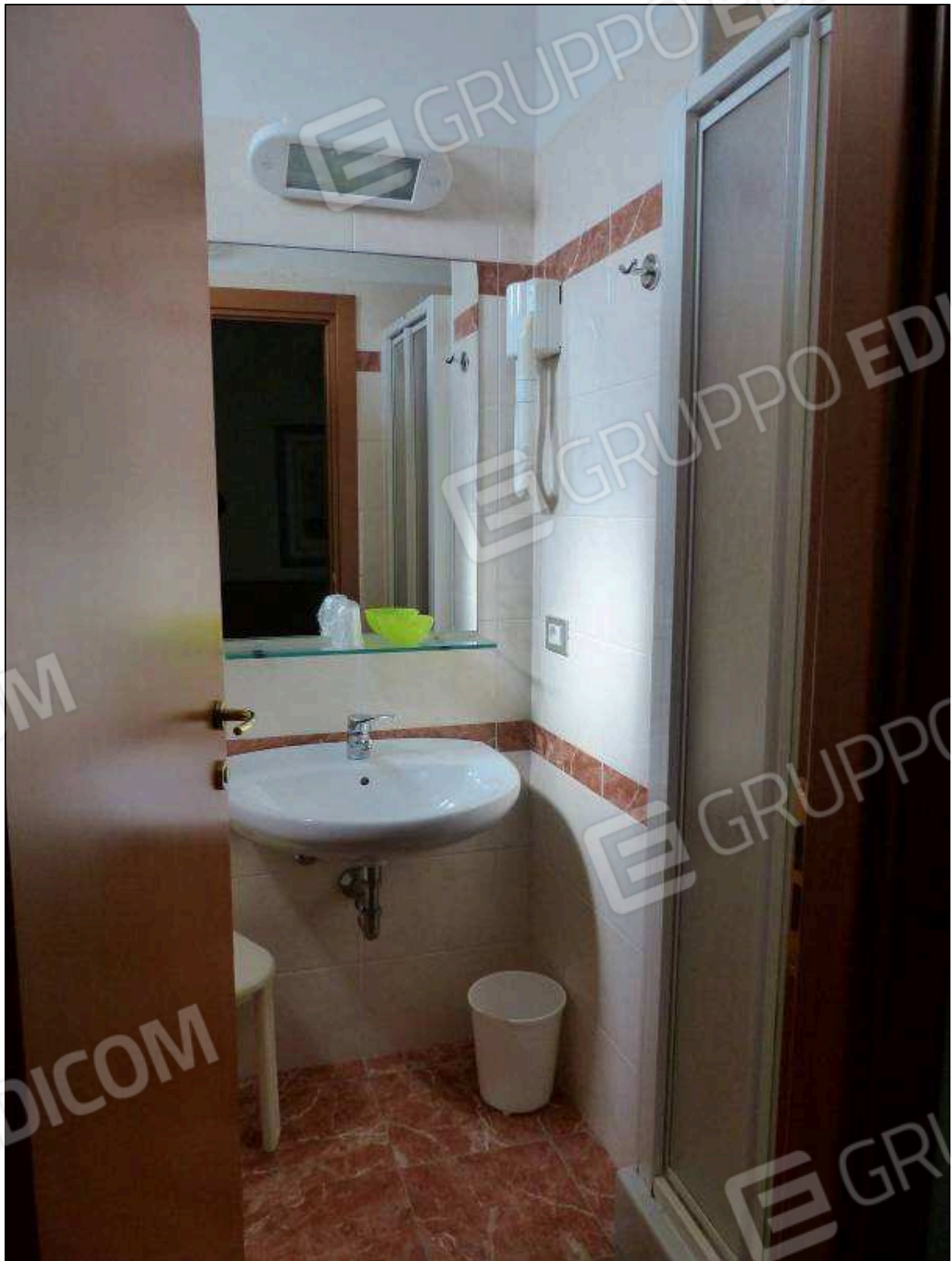
FOTO 76 – Piano terzo: bagno in camera tipo dell'albergo "Hotel ██████".