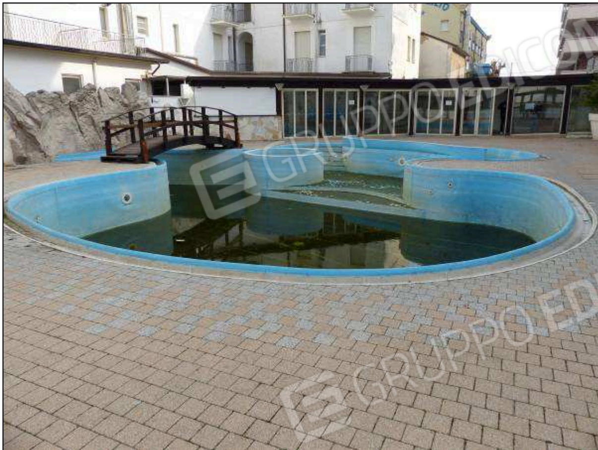
FOTO 41 – Piano terra: piscina comune agli alberghi “Hotel [REDACTED]” e “Hotel [REDACTED]”.