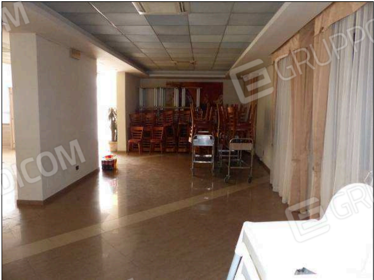
FOTO 51 - Piano terra: sala prima colazione dell'albergo "Hotel ██████".