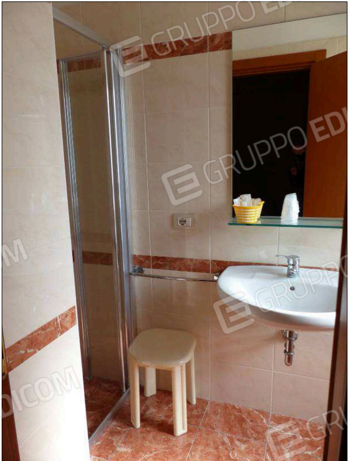
FOTO 80 - Piano quarto: bagno della camera familiare dell'albergo "Hotel [REDACTED]".