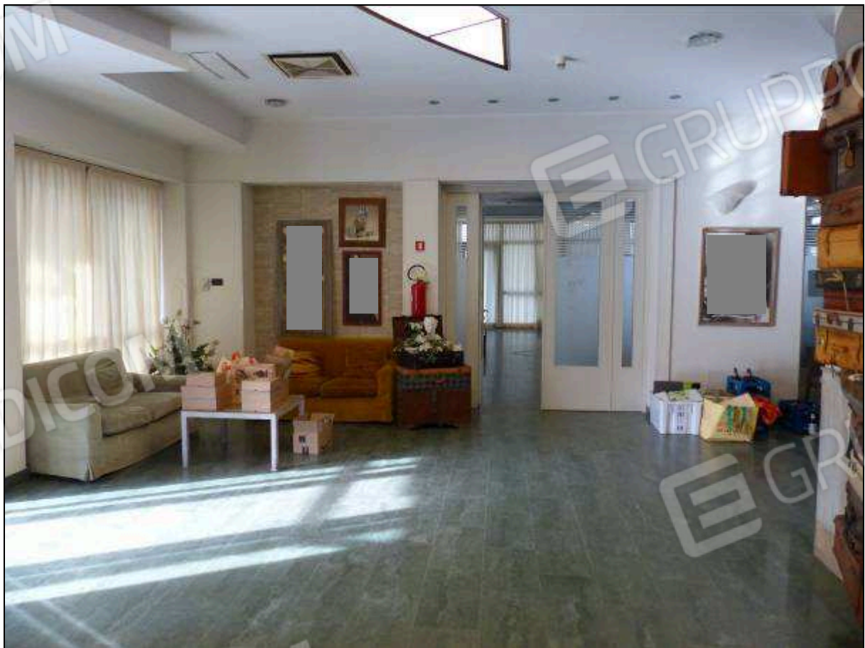
FOTO 7 – Piano terra: soggiorno di ingresso dell'albergo "Hotel ████████".