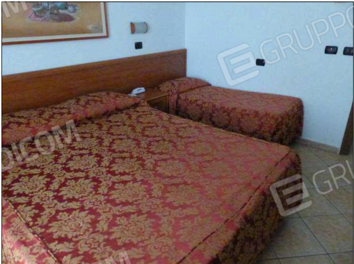
FOTO 25 - Piano terzo: camera tipo dell'albergo "Hotel ████████".