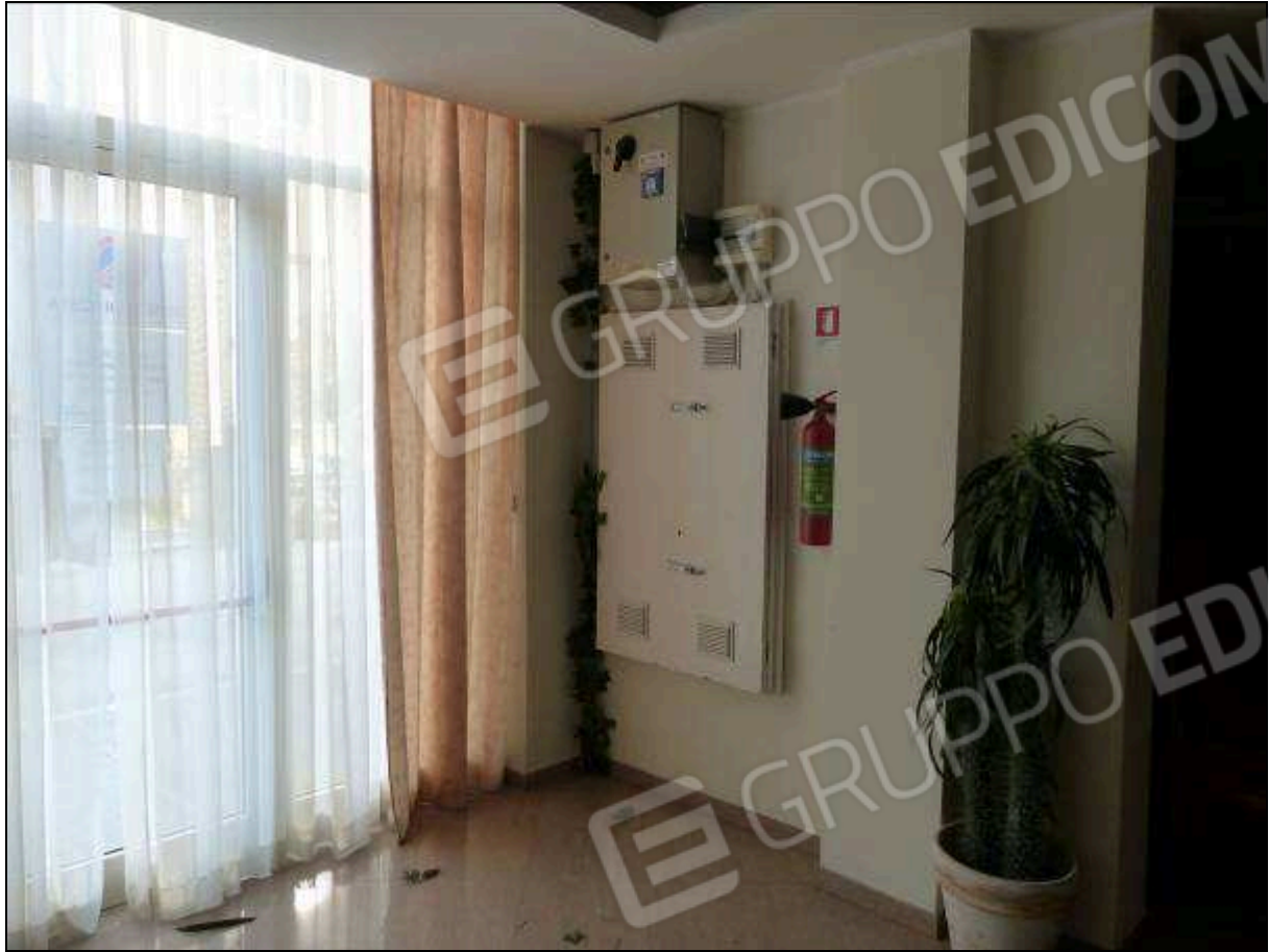
FOTO 54 – Piano terra: uscita di emergenza su Via Capodistria dell'albergo "Hotel ██████".