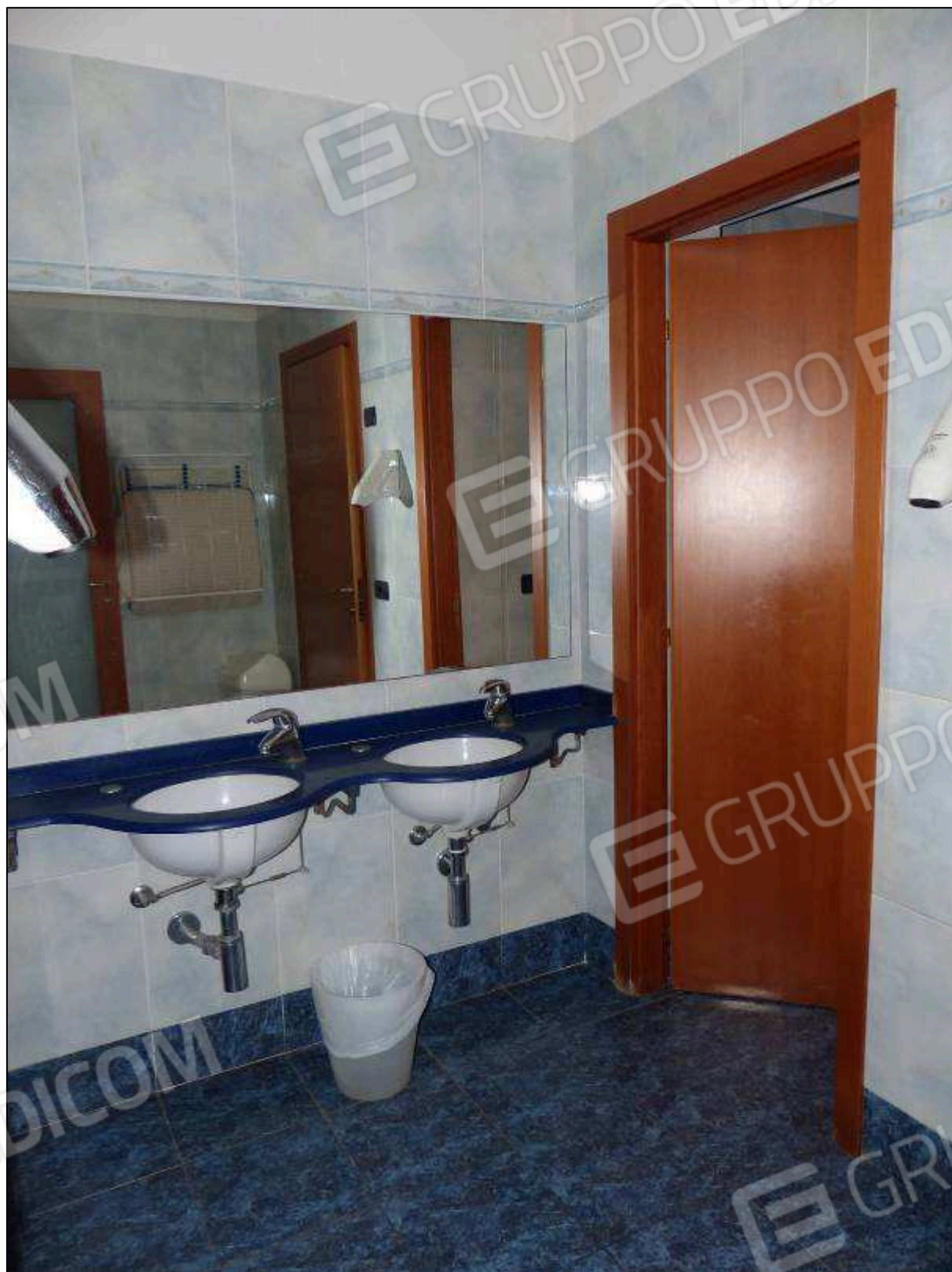
FOTO 38 – Piano terra: servizi igienici in corrispondenza del portico di collegamento tra gli alberghi.