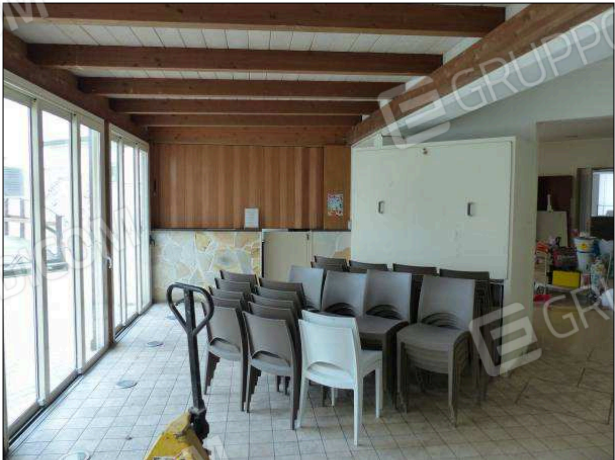
FOTO 37 – Piano terra: portico di collegamento tra gli alberghi "Hotel ████████" e "Hotel ████████".