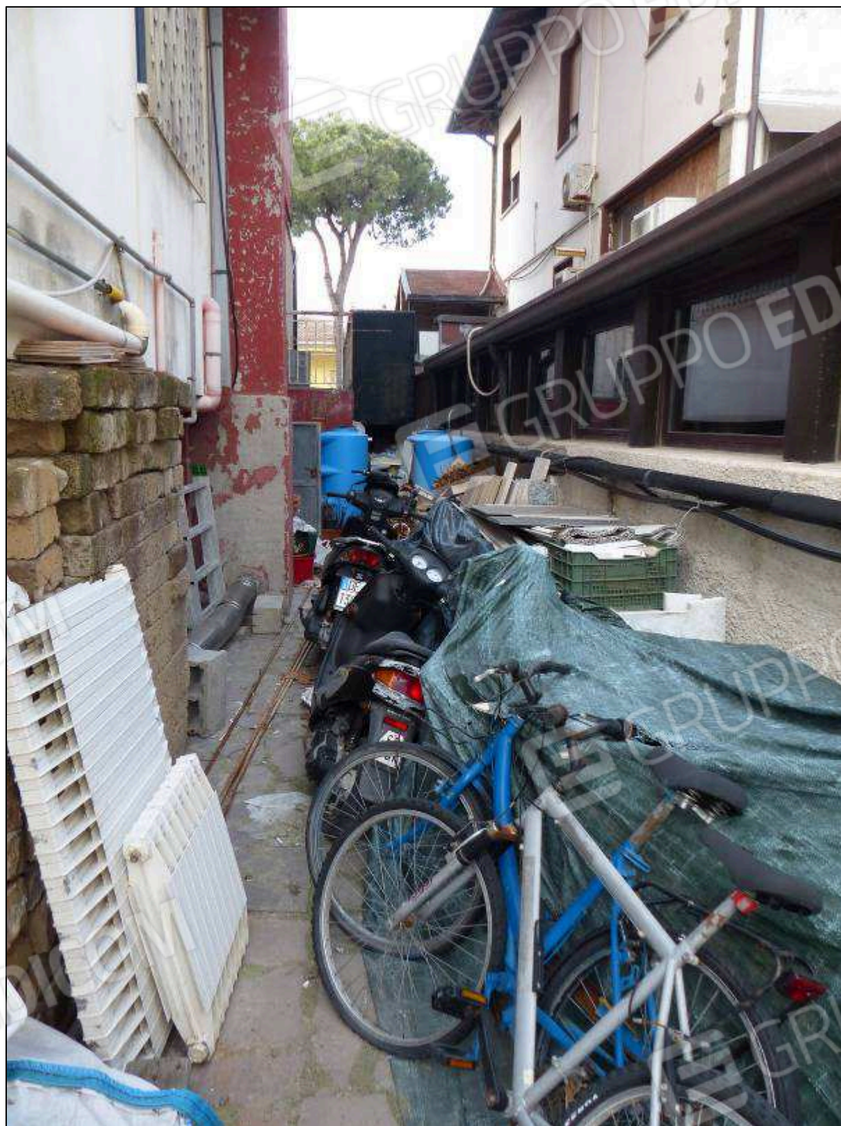
FOTO 85 – Piano terra: passaggio di collegamento per raggiungere gli impianti idraulici (a servizio dei due alberghi) ubicati in altra proprietà.