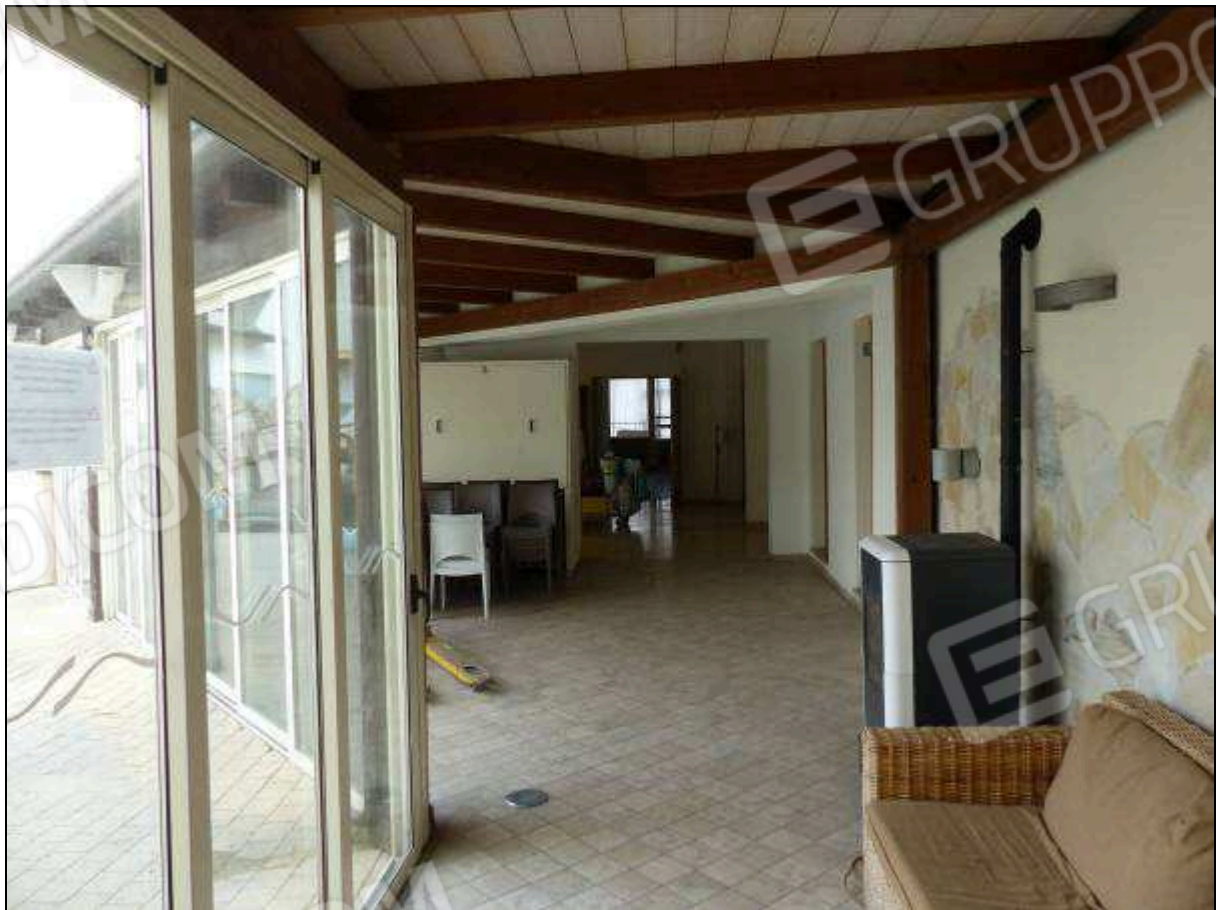
FOTO 35 – Piano terra: portico di collegamento tra gli alberghi "Hotel ████████" e "Hotel ████████".