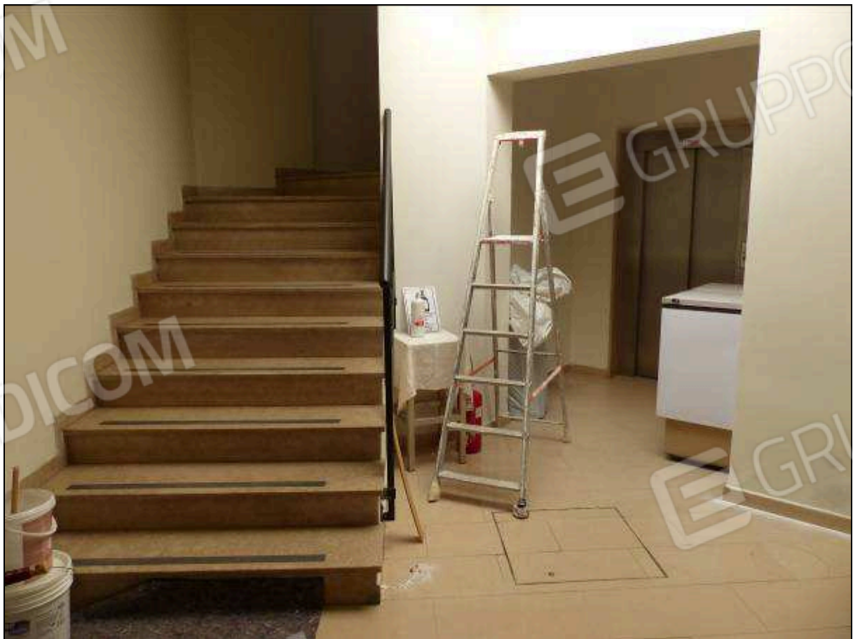
FOTO 64 - Piano terra: disimpegno, scala comune e vano ascensore dell'albergo "Hotel ██████".