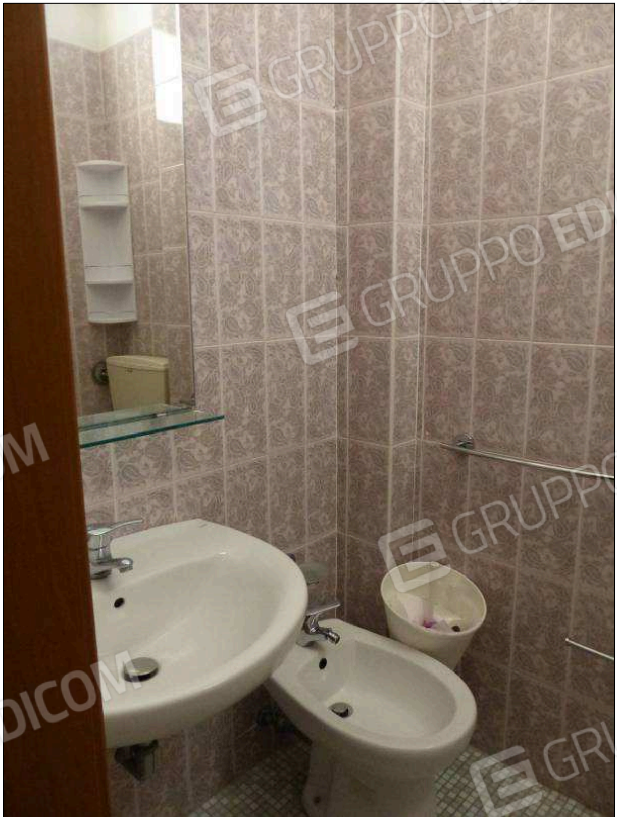
FOTO 71 - Piano secondo: bagno in camera tipo dell'albergo "Hotel [REDACTED]".