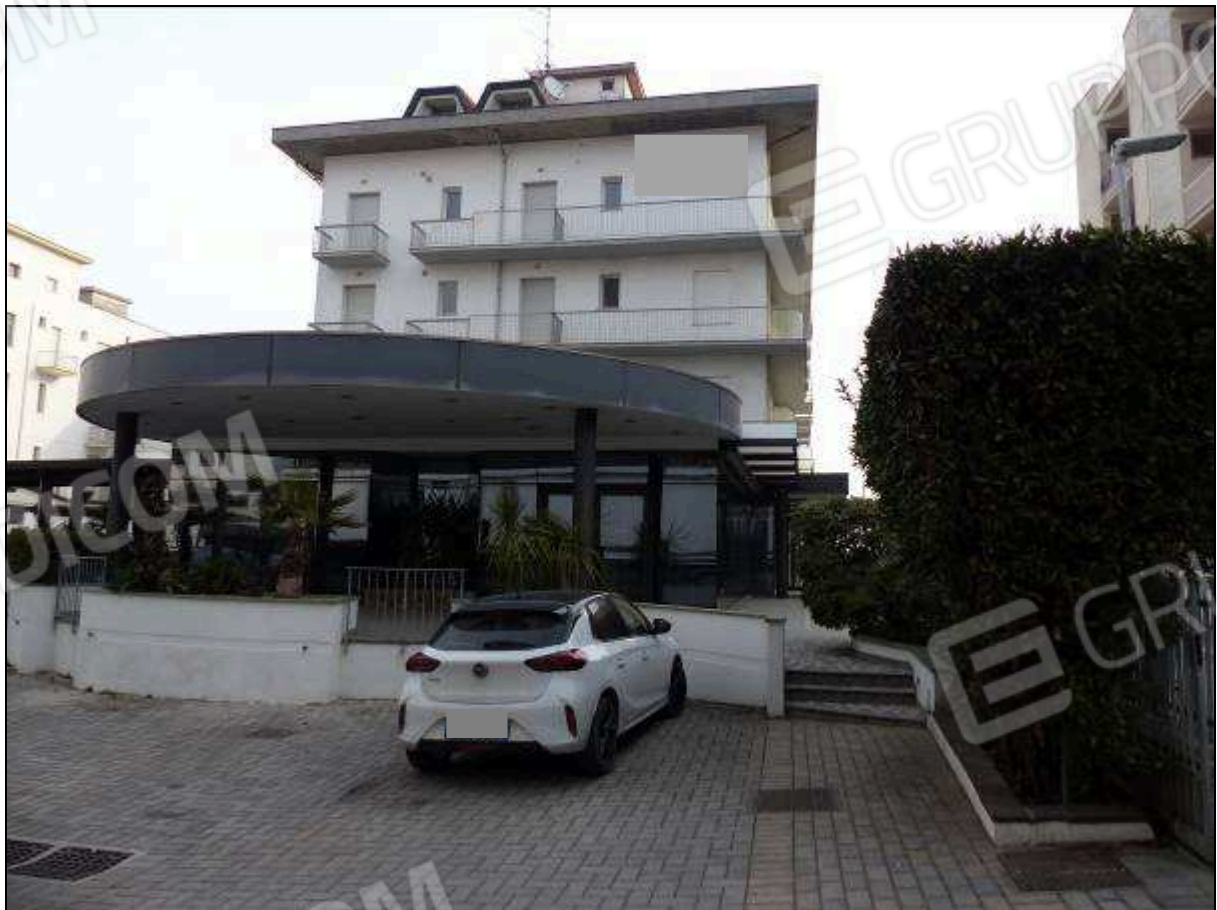
FOTO 2 – Prospetto lato monte (visto dal parcheggio) dell'albergo "Hotel [redacted]".