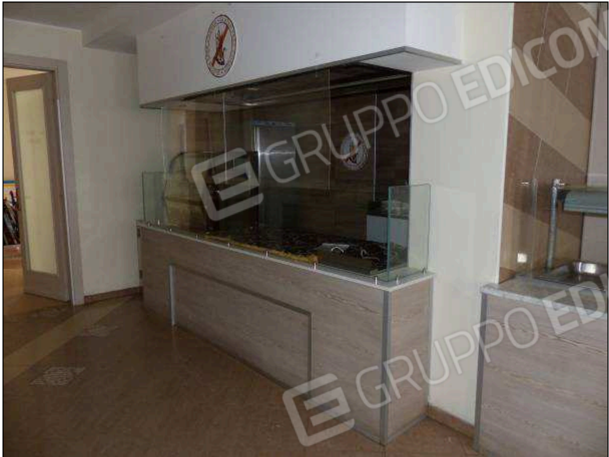
FOTO 63 – Piano terra: corridoio nella sala prima colazione dell'albergo "Hotel ██████".