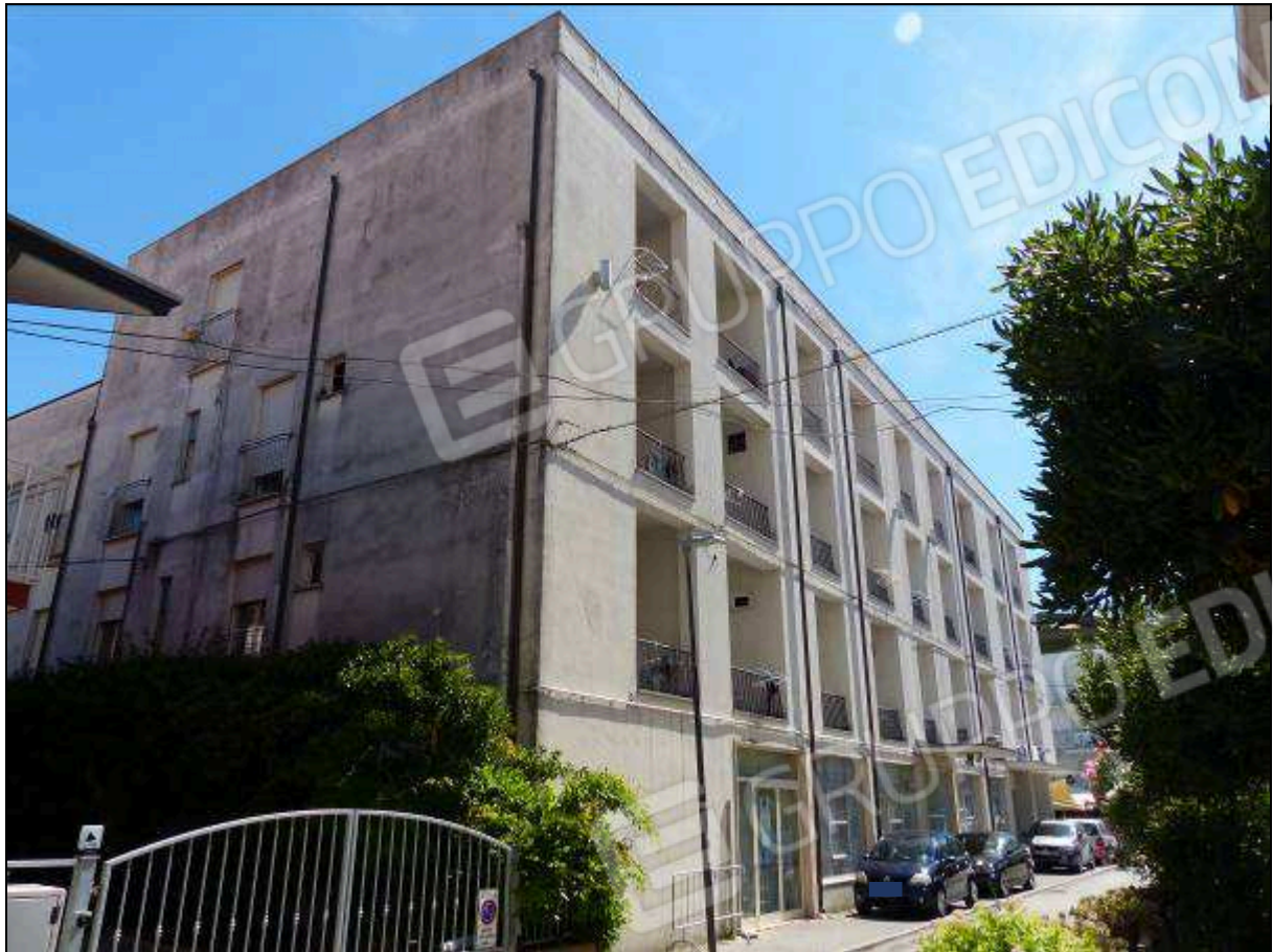
FOTO 50 - Prospetto lato mare (da Via Capodistria) dell'albergo "Hotel ██████".