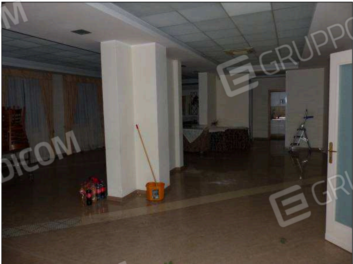
FOTO 53 – Piano terra: sala prima colazione dell'albergo "Hotel ██████".