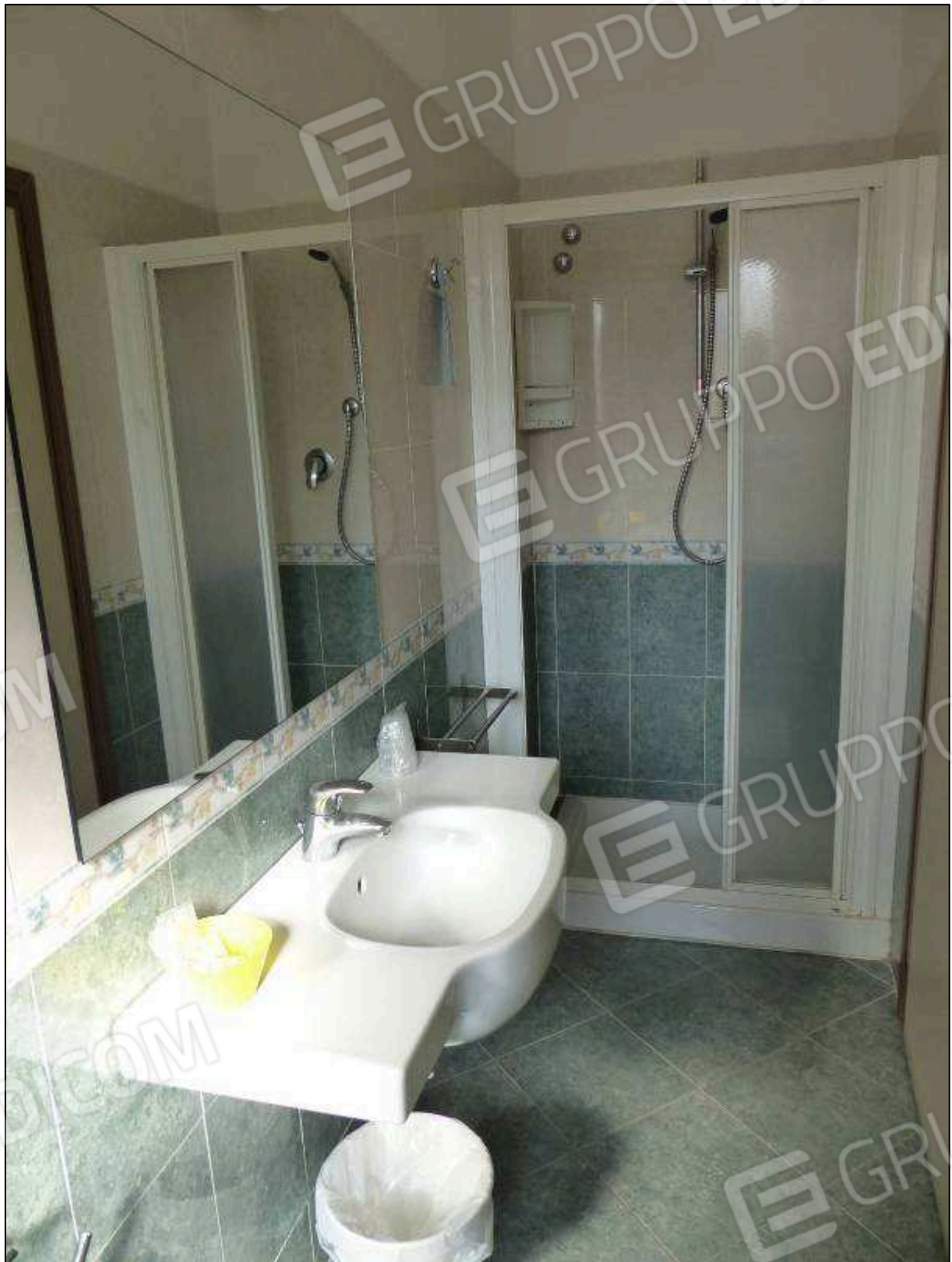
FOTO 17 – Piano primo: bagno in camera tipo dell'albergo "Hotel [REDACTED]".