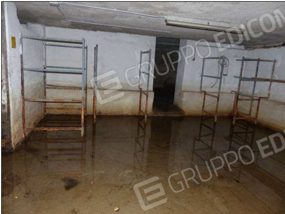
FOTO 46 – Piano interrato: cantine (con ingenti infiltrazioni di acqua) dell'albergo "Hotel [REDACTED]".