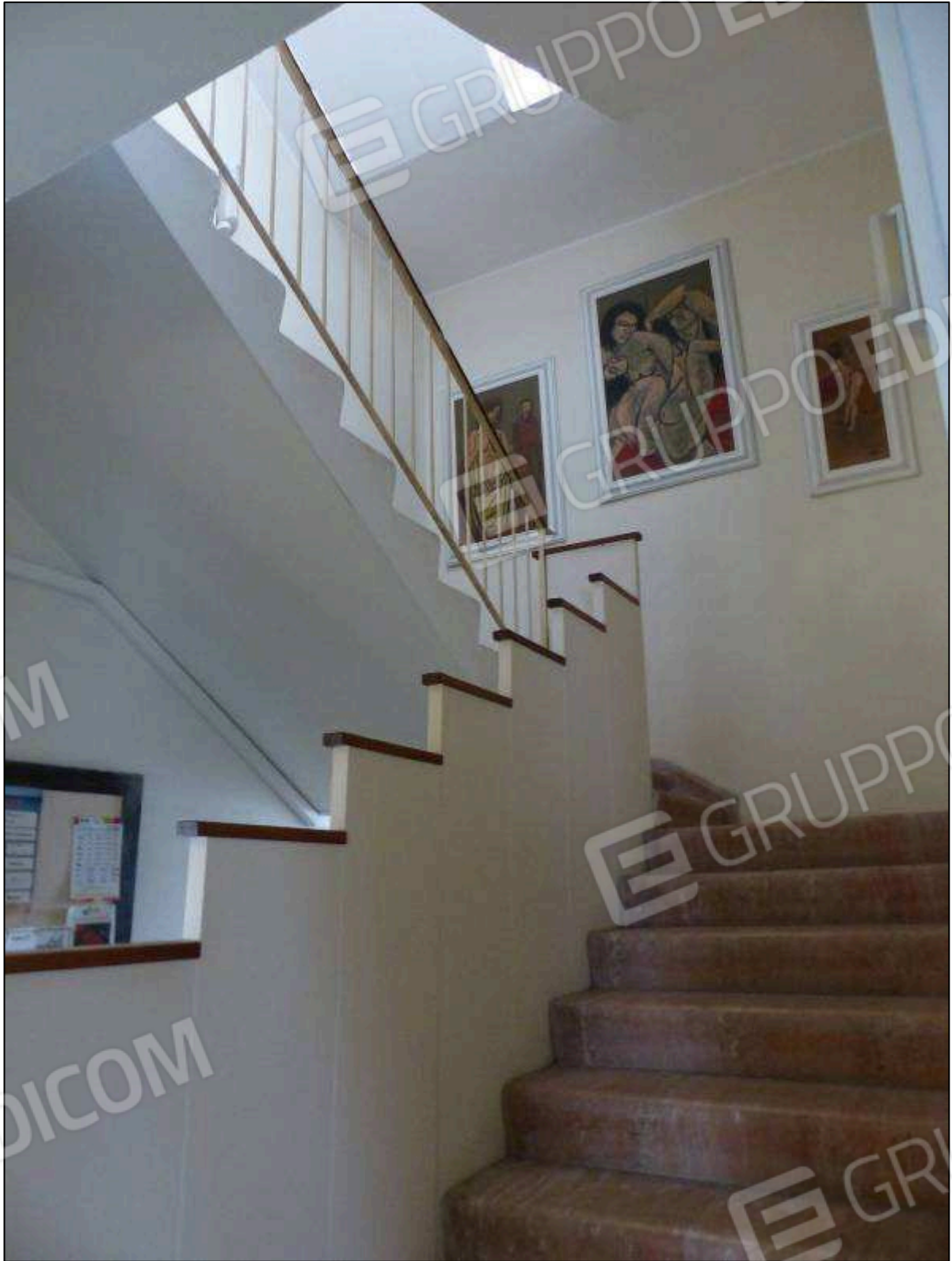
FOTO 12 – Piano terra: scala di accesso al piano primo dell'albergo "Hotel ██████████".