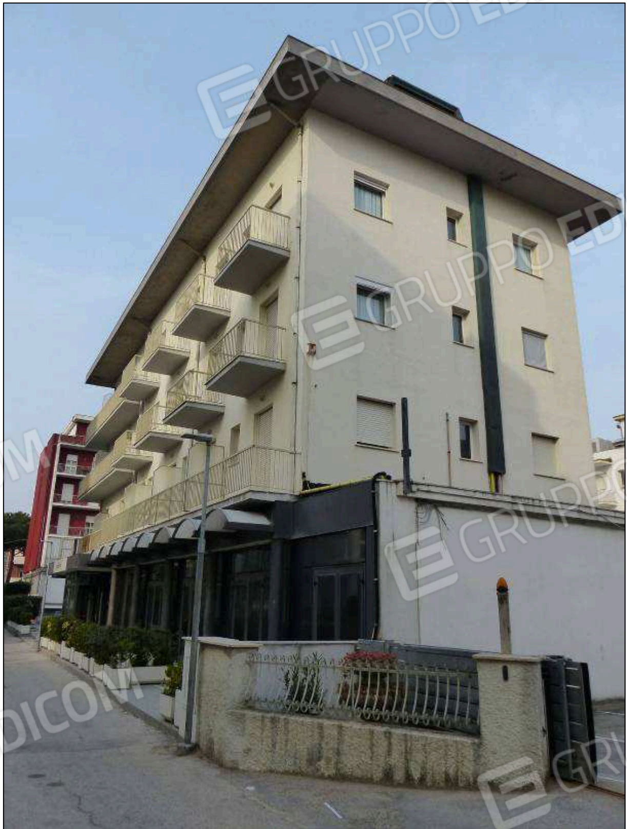
FOTO 3 – Prospetto lato mare (visto da Via Pirano) dell'albergo "Hotel [REDACTED]".