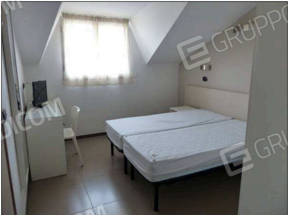
FOTO 29 – Piano sottotetto: camera tipo dell'albergo "Hotel ████████".