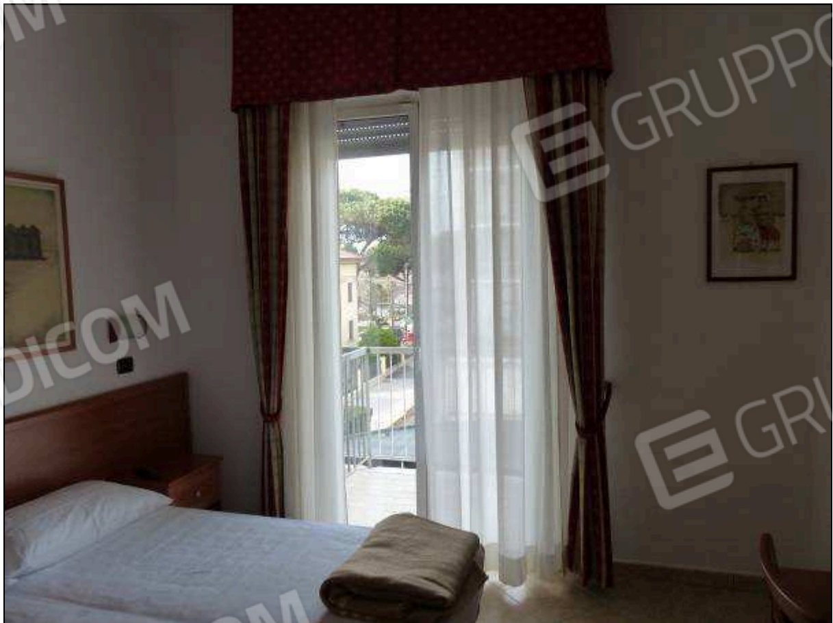
FOTO 20 – Piano secondo: camera tipo dell'albergo "Hotel ████████".