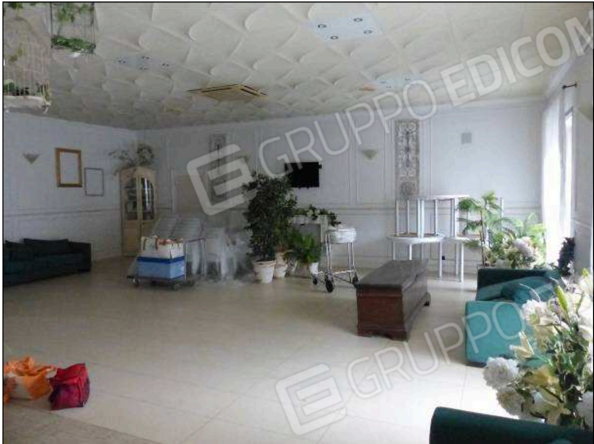
FOTO 10 - Piano terra: sala da pranzo dell'albergo "Hotel ████████".