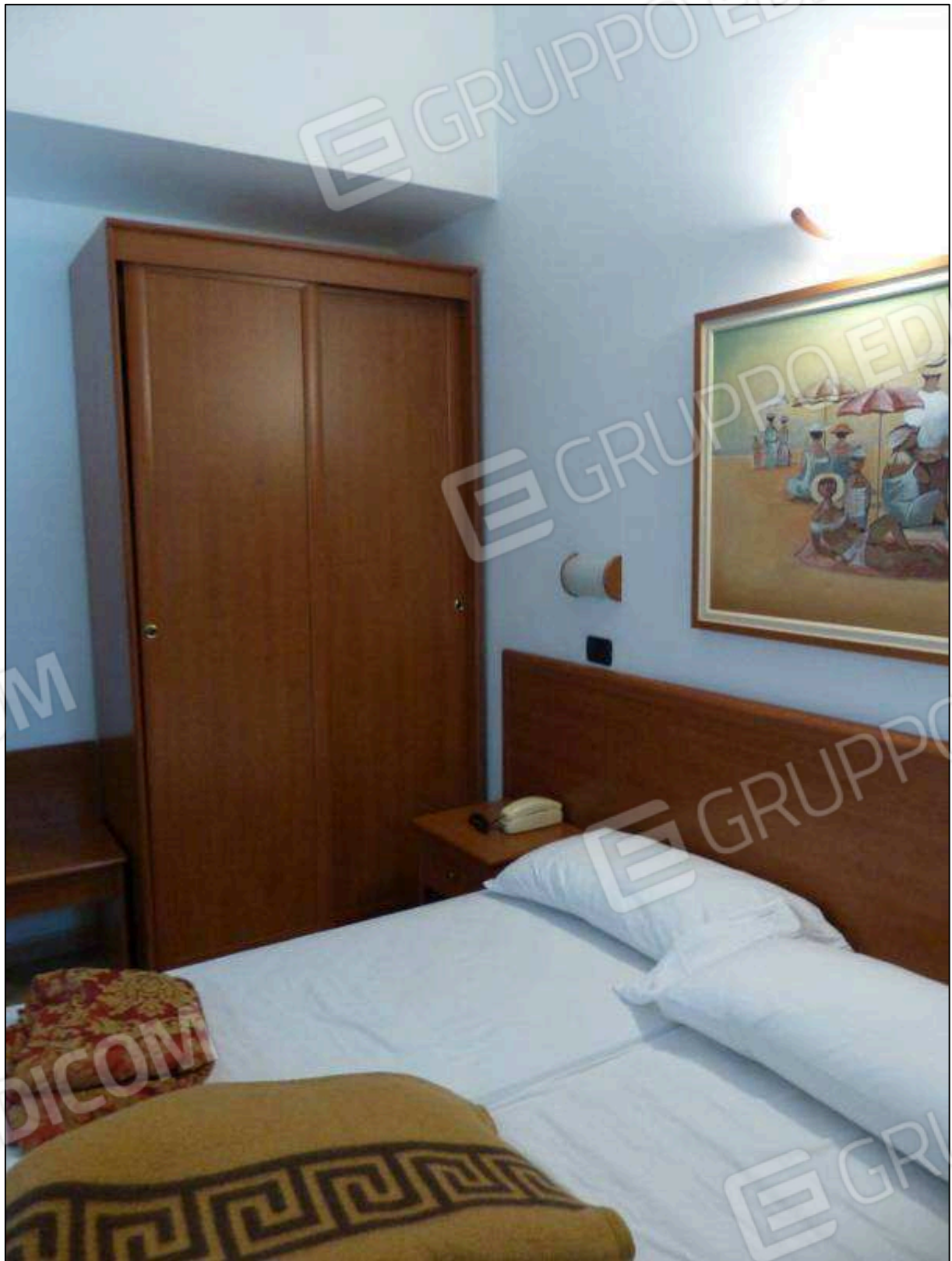
FOTO 15 – Piano primo: camera tipo dell'albergo "Hotel [REDACTED]".