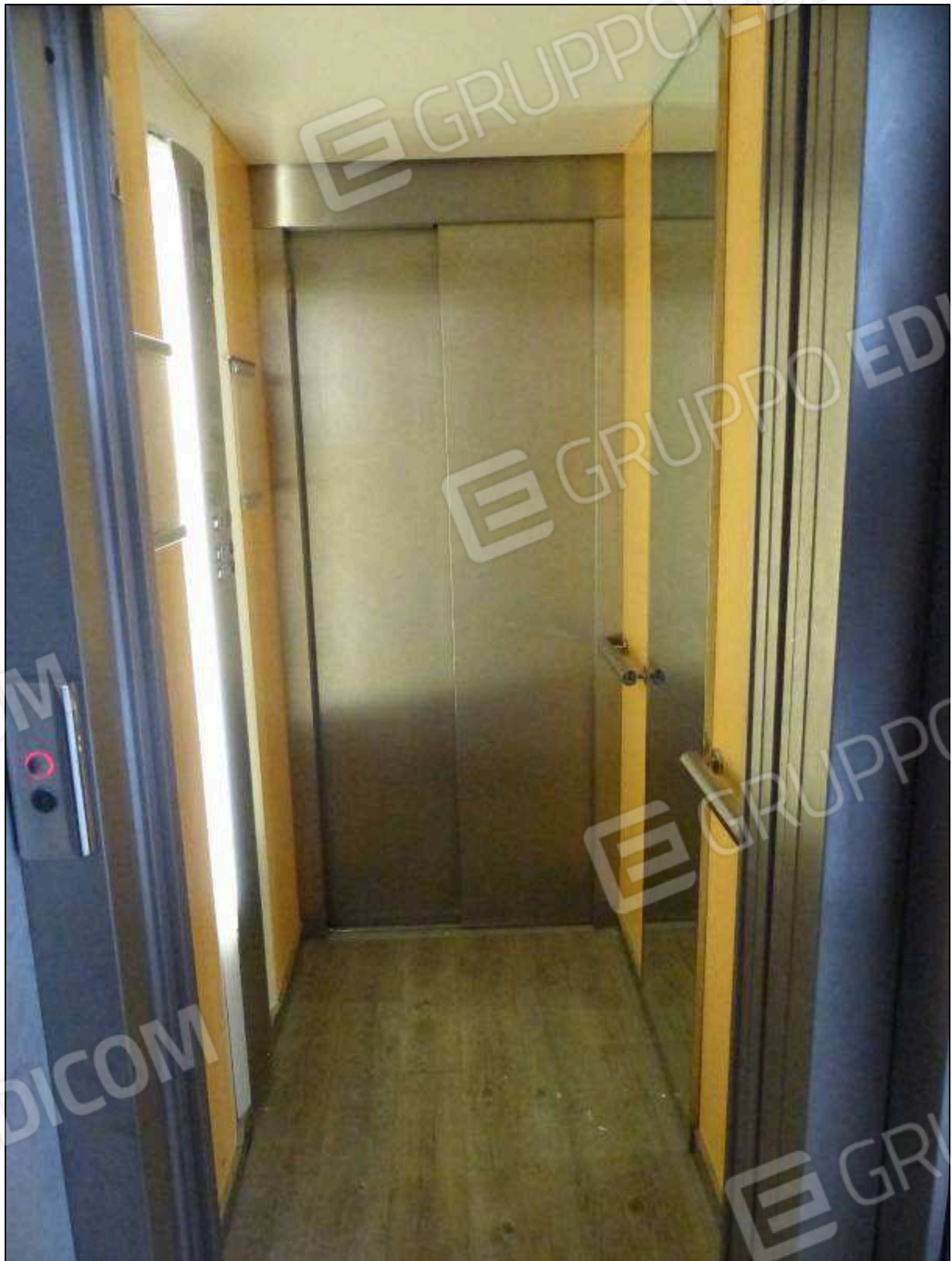
FOTO 73 - Piano terzo: cabina ascensore dell'albergo "Hotel [REDACTED]".