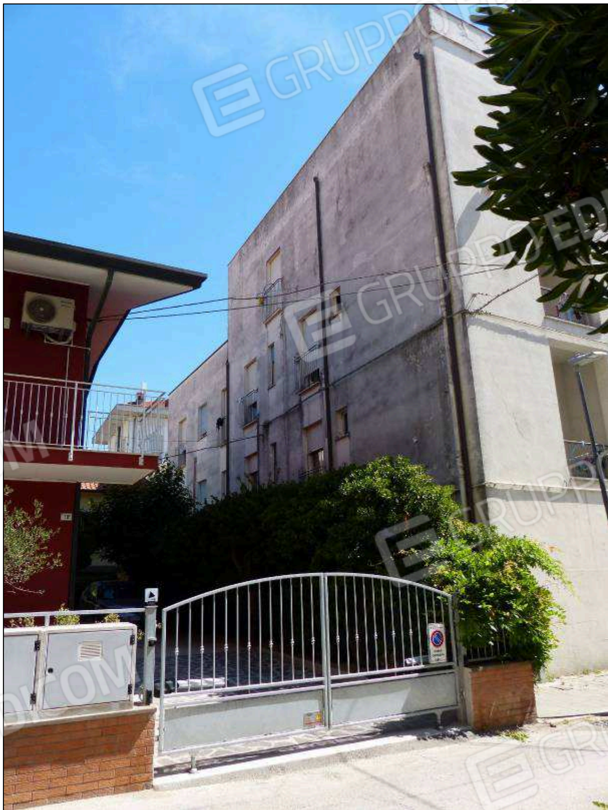
FOTO 49 – Prospetto lato mare (da Via Capodistria) dell'albergo "Hotel ██████".