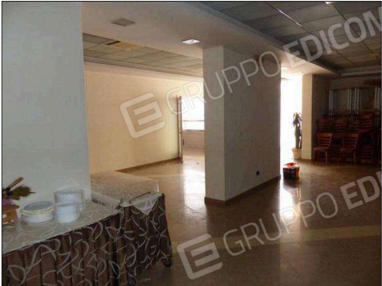
FOTO 52 – Piano terra: sala prima colazione dell'albergo "Hotel ██████".