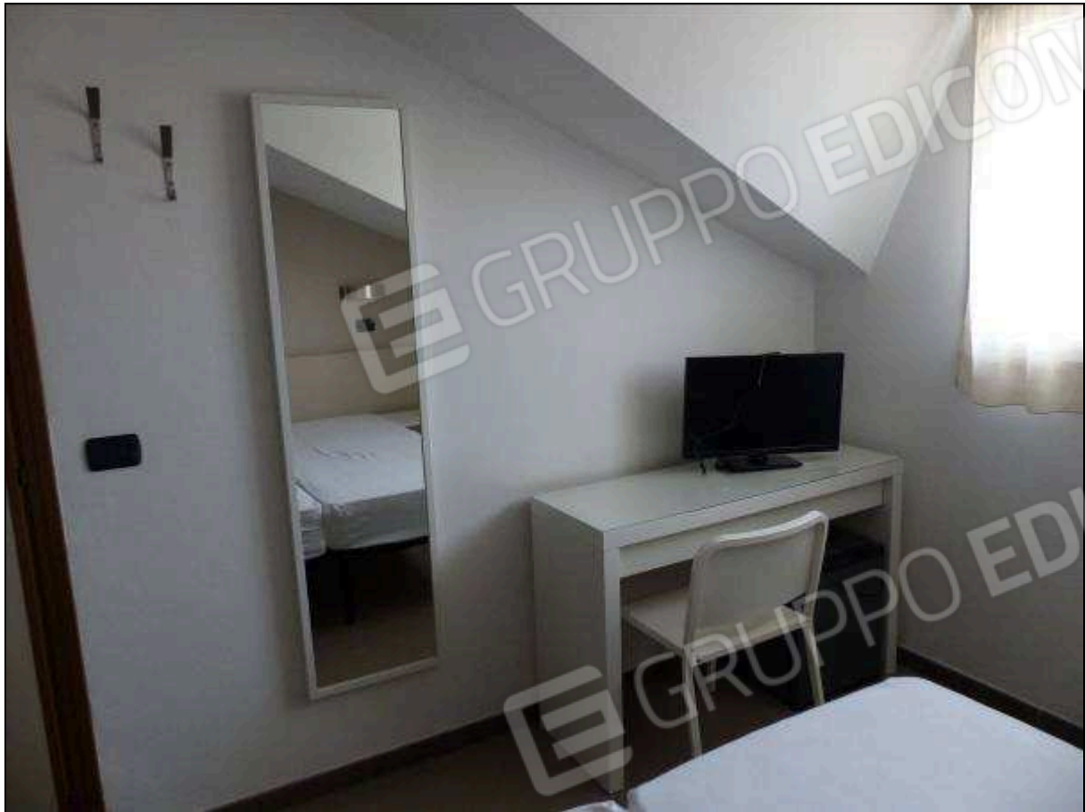
FOTO 30 – Piano sottotetto: camera tipo dell'albergo "Hotel ████████".