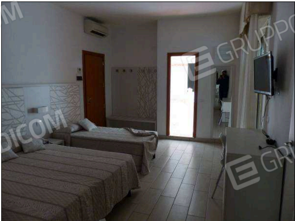
FOTO 79 – Piano quarto: camera familiare dell'albergo "Hotel [REDACTED]".