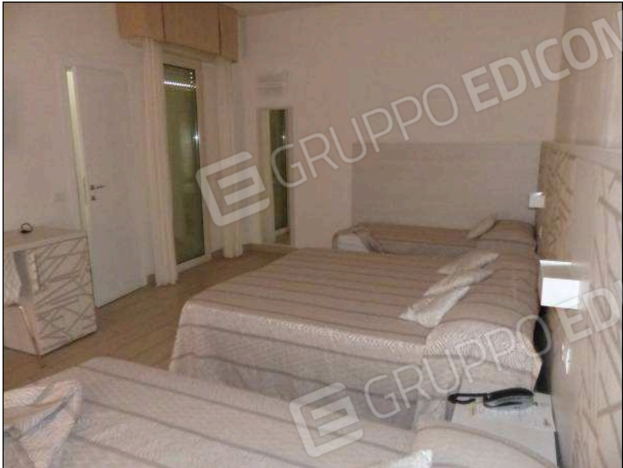
FOTO 78 – Piano quarto: camera familiare dell'albergo "Hotel [REDACTED]".