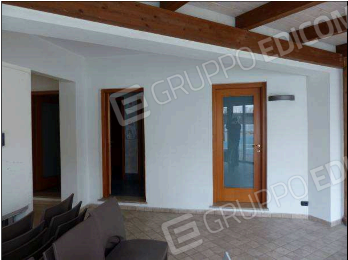
FOTO 36 – Piano terra: vani di servizio in corrispondenza del portico di collegamento tra gli alberghi.