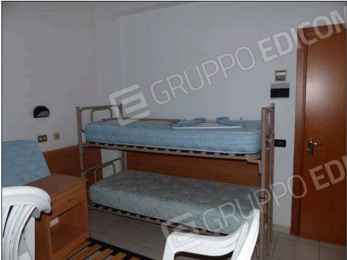
FOTO 69 – Piano secondo: camera tipo dell'albergo "Hotel [REDACTED]".