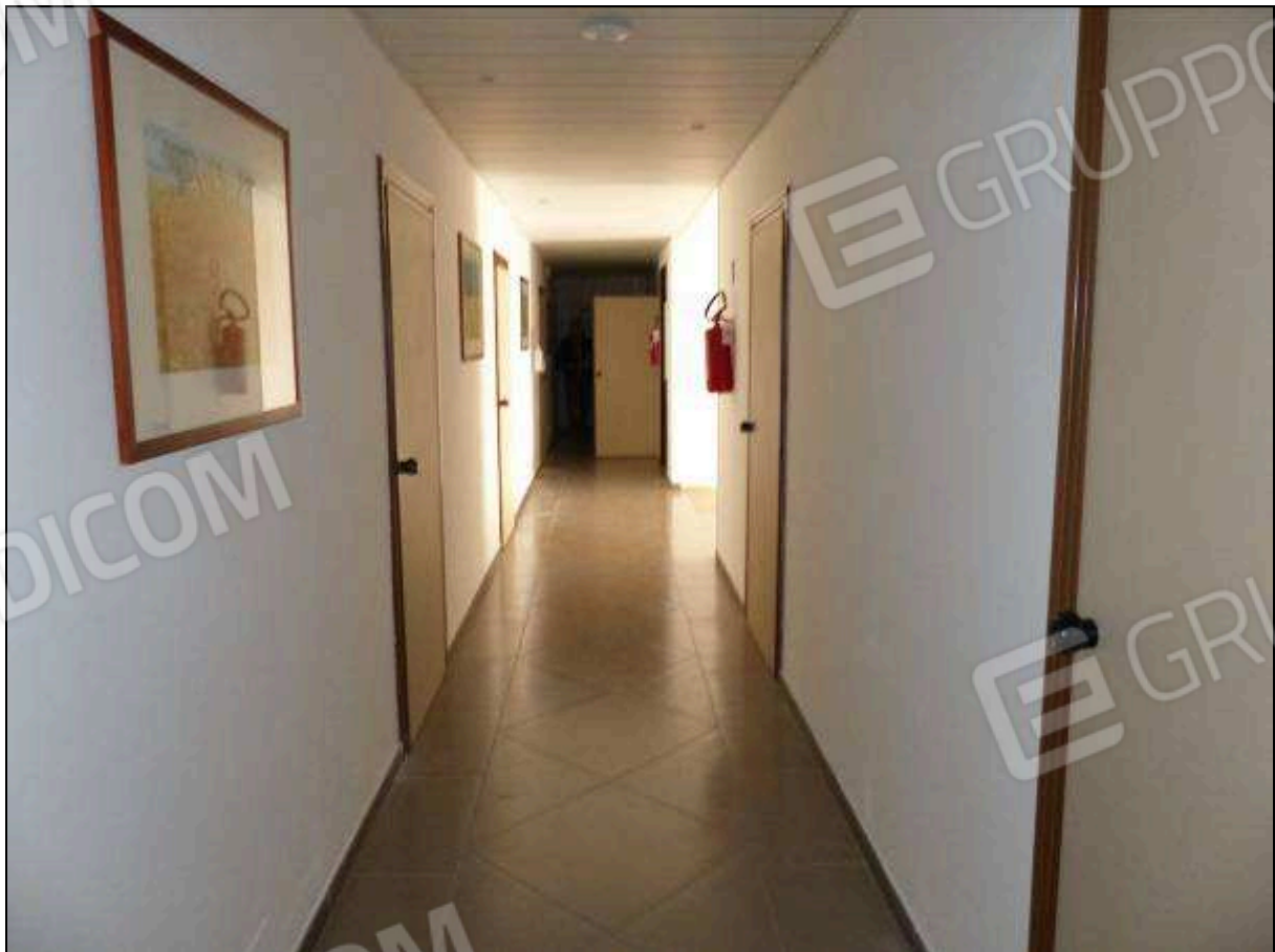
FOTO 31 - Piano sottotetto: corridoio di disimpegno dell'albergo "Hotel ████████".