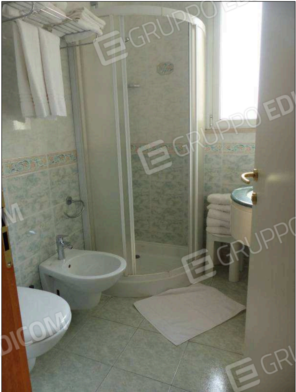
FOTO 26 – Piano terzo: bagno in camera tipo dell'albergo "Hotel [REDACTED]".