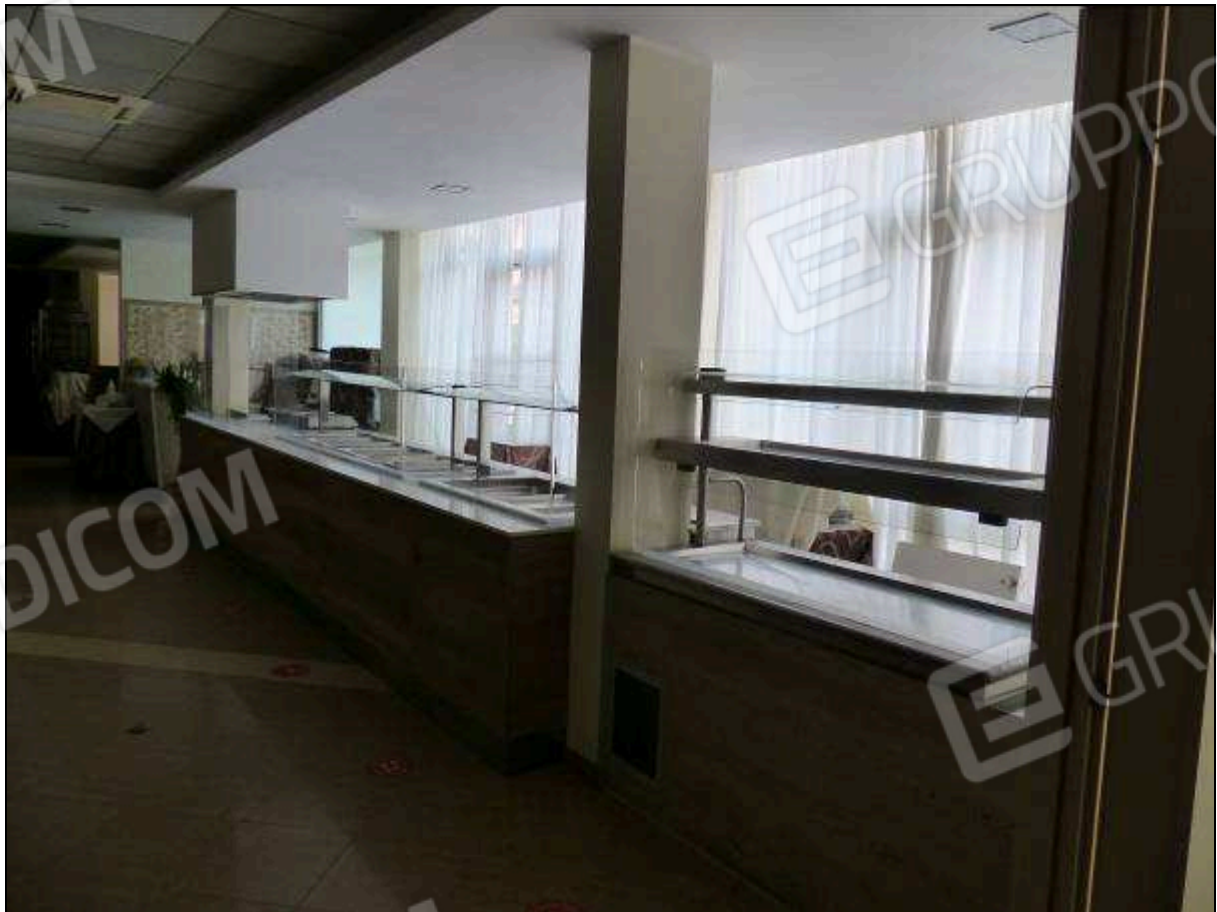
FOTO 55 – Piano terra: sala prima colazione dell'albergo "Hotel ██████".