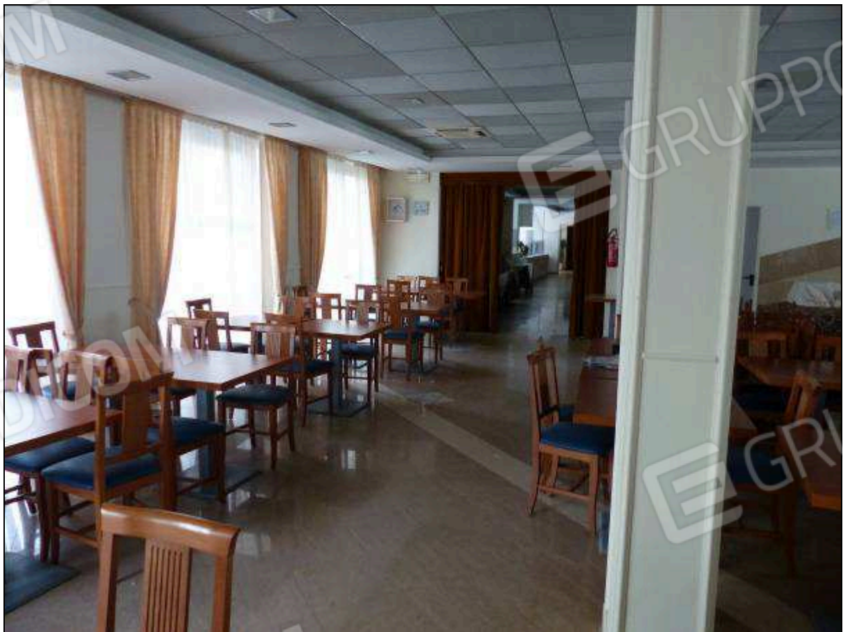
FOTO 59 - Piano terra: sala da pranzo dell'albergo "Hotel ██████".