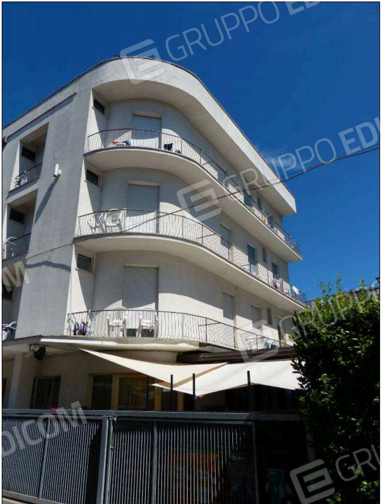
FOTO 48 - Prospetto principale (da Via Capodistria) dell'albergo "Hotel [redacted]".