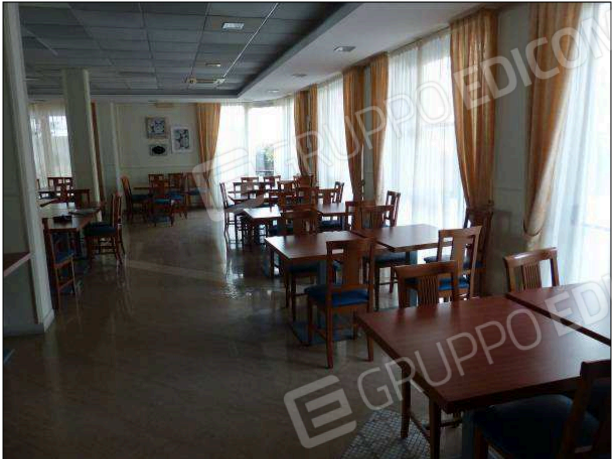
FOTO 58 – Piano terra: sala da pranzo dell'albergo "Hotel ██████".