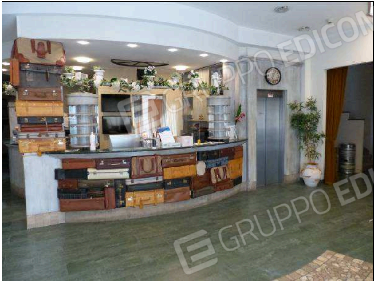
FOTO 6 – Piano terra: hall e bureau di reception dell'albergo "Hotel ████████".