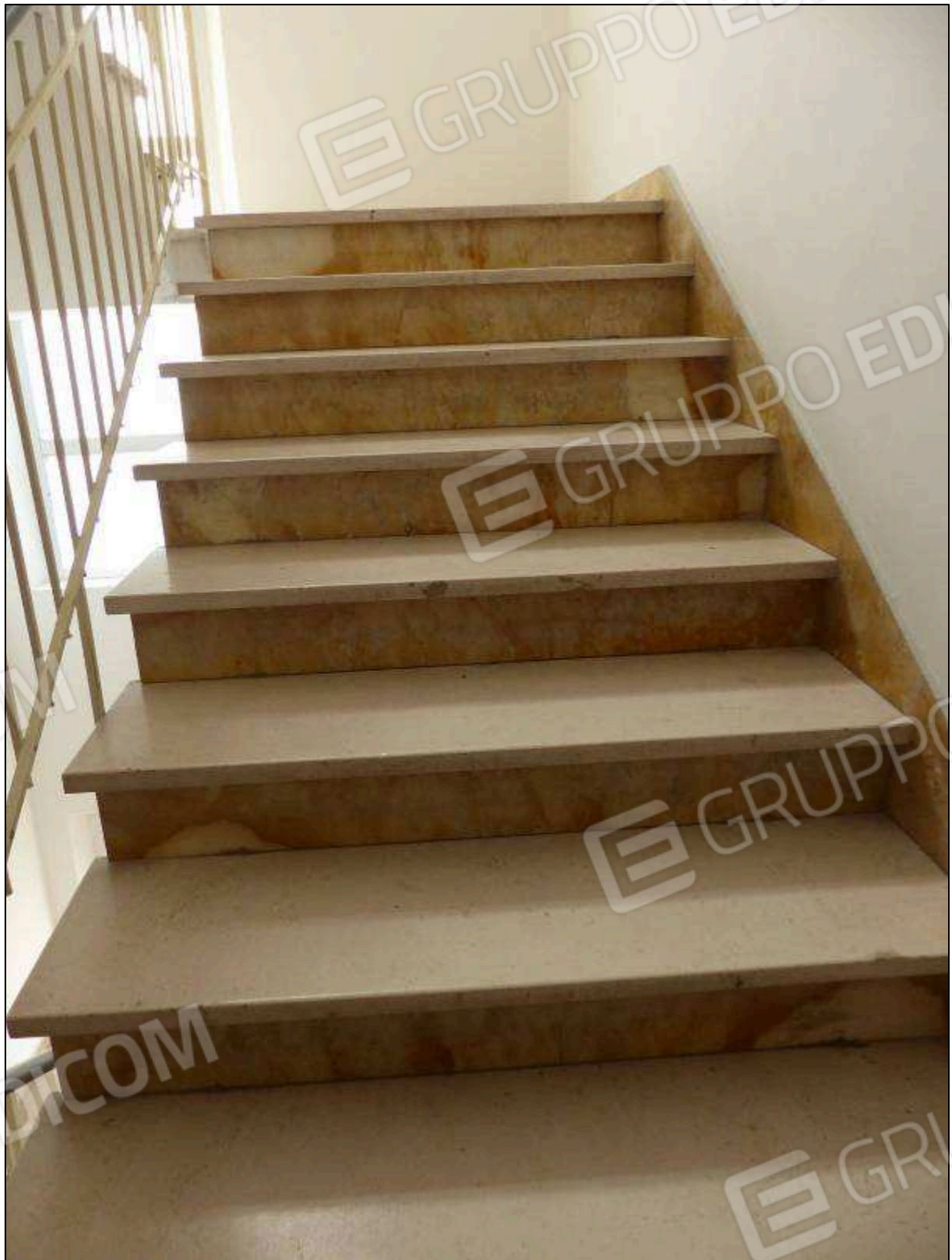
FOTO 72 – Piano secondo: scala comune dell'albergo "Hotel ██████".