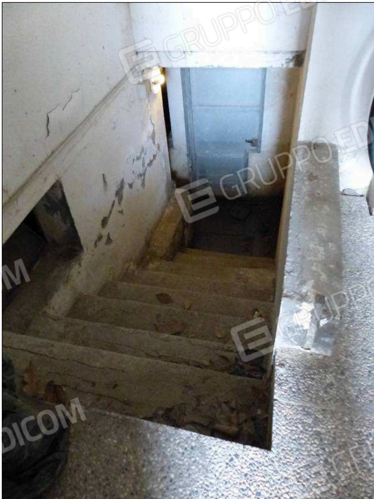
FOTO 45 - Piano terra: scala di accesso al vano interrato dell'albergo "Hotel [REDACTED]".