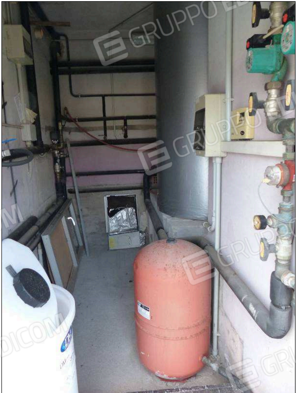
FOTO 84 - Piano copertura: vano tecnico per macchinari di impianto dell'albergo "Hotel ██████████".