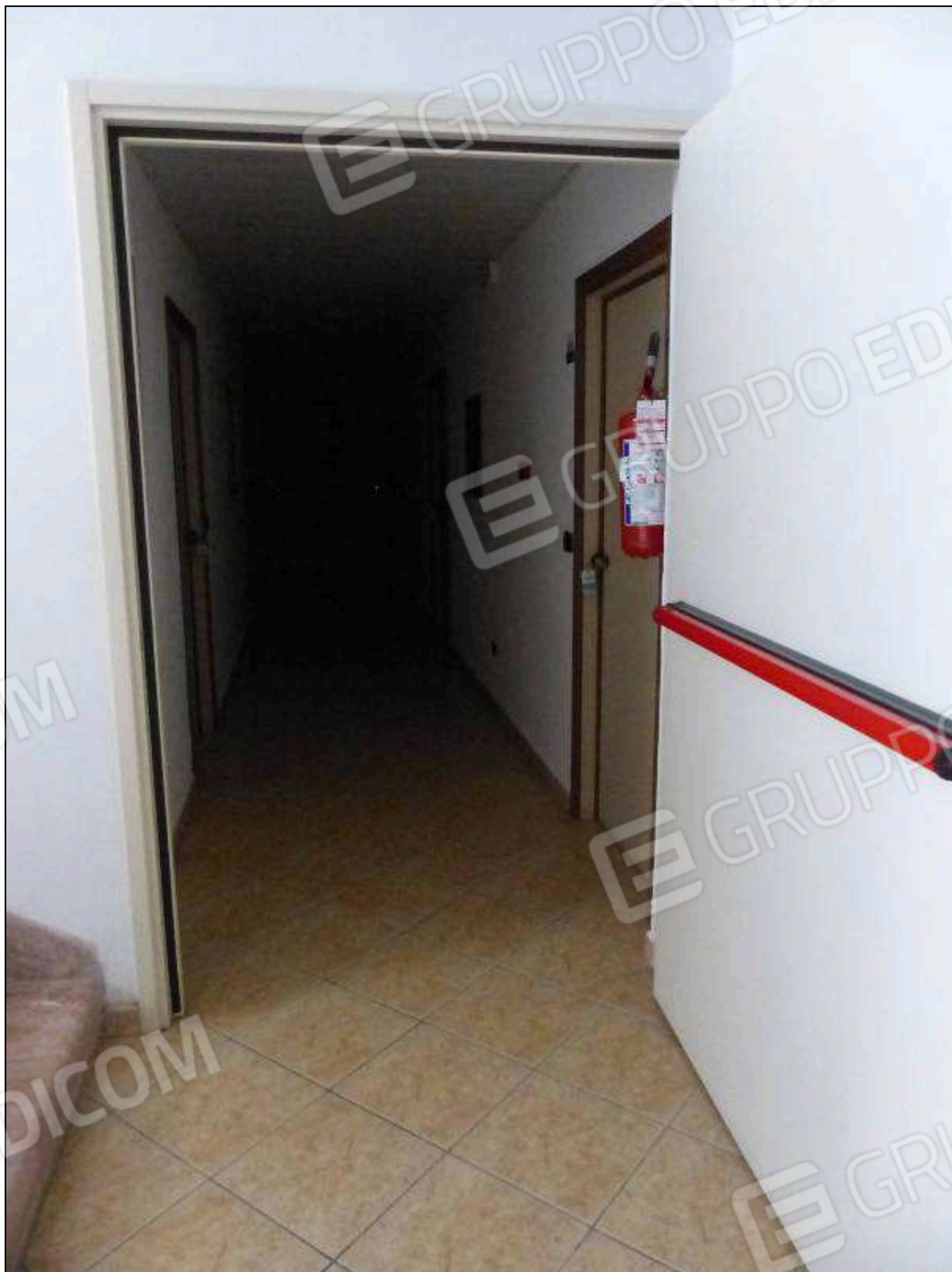
FOTO 23 - Piano secondo: corridoio di disimpegno dell'albergo "Hotel [REDACTED]".