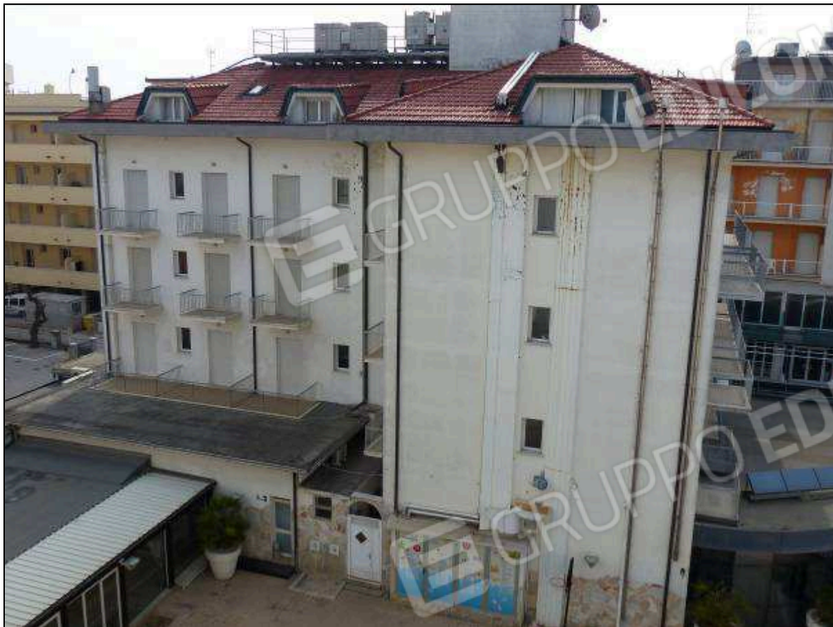
FOTO 4 – Prospetto retro (visto dal balcone dell'albergo "Hotel ██████") dell'albergo "Hotel ██████".