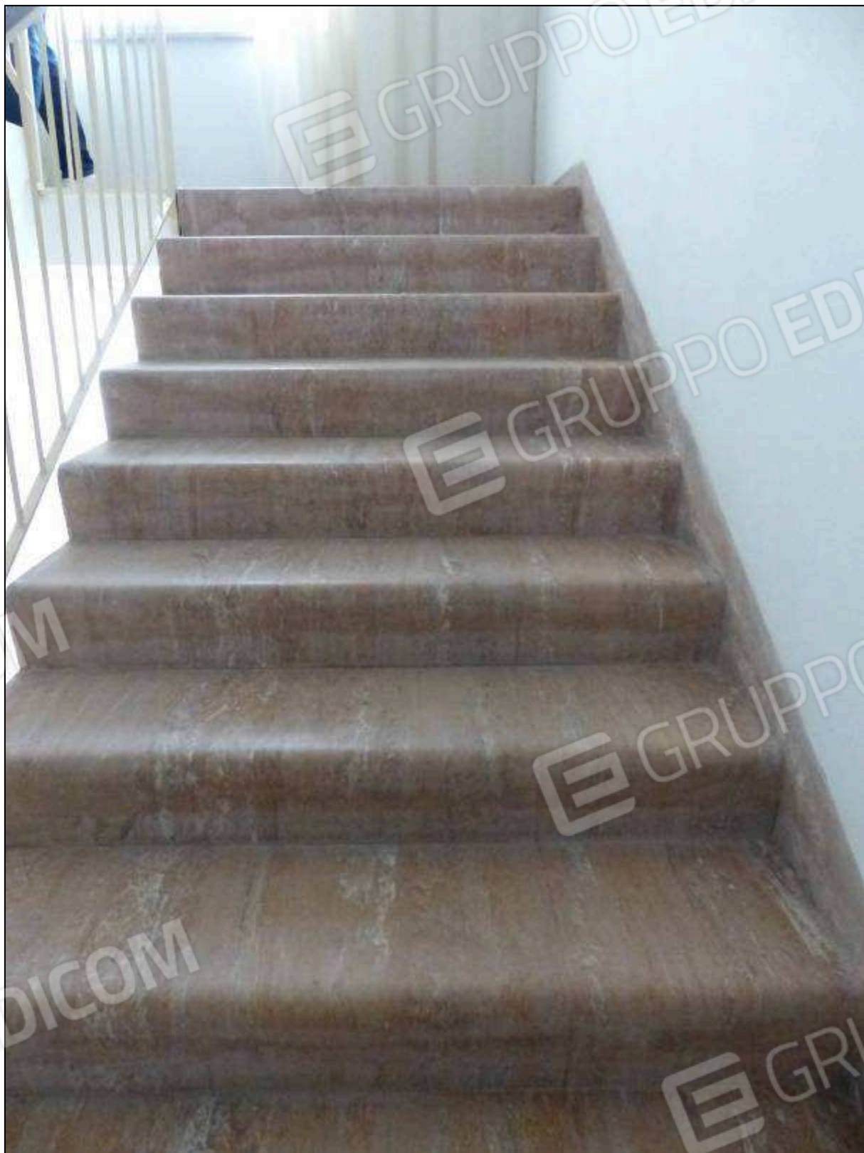
FOTO 27 – Piano terzo: scala comune dell'albergo "Hotel [REDACTED]".