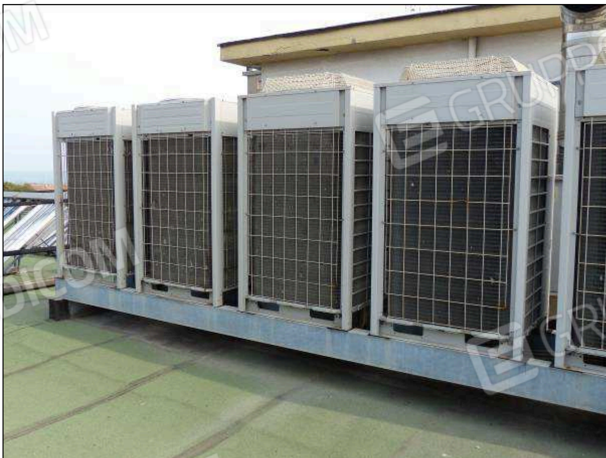
FOTO 83 - Piano copertura: macchinari di impianto dell'albergo "Hotel ████████".