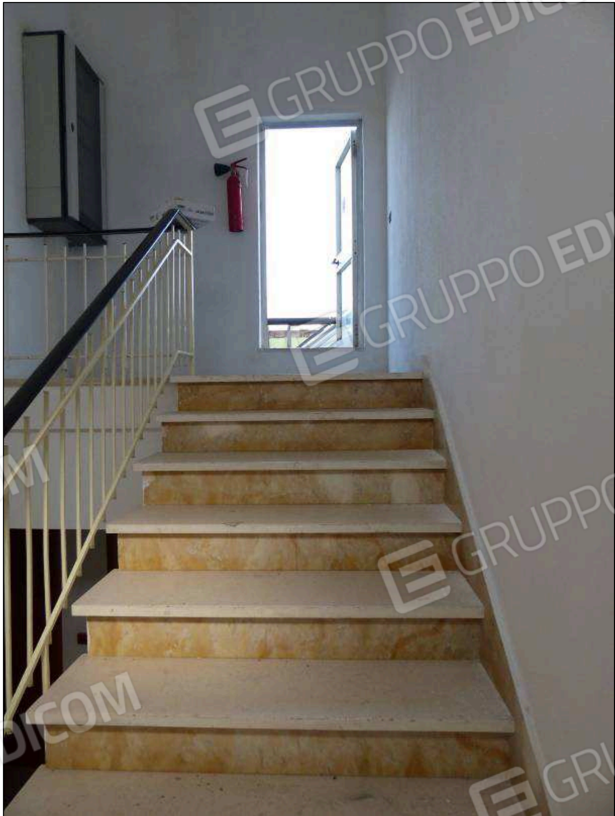
FOTO 81 - Piano quarto: scala di accesso alla copertura dell'albergo "Hotel [REDACTED]".