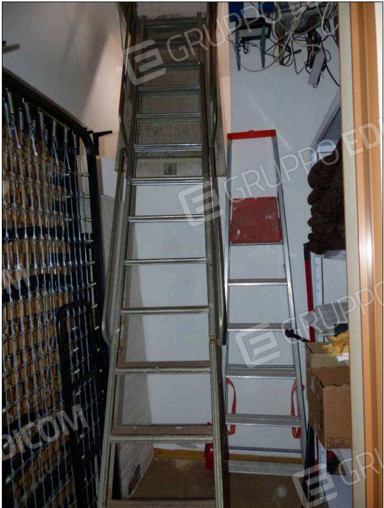
FOTO 33 – Piano sottotetto: scala e botola di accesso alla copertura dell'albergo "Hotel ██████████".