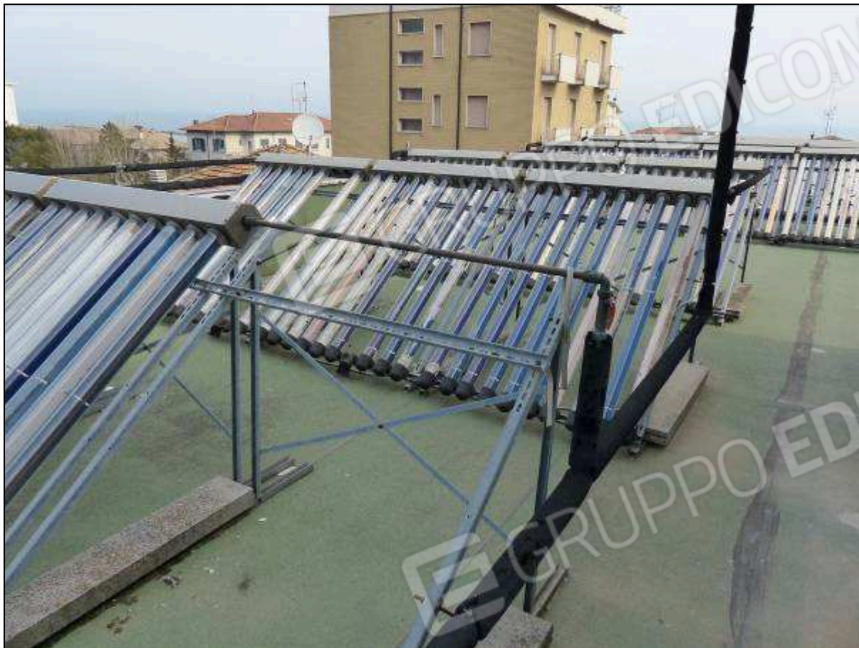
FOTO 82 – Piano copertura: impianto solare/termico (non funzionante) dell'albergo "Hotel ████████".