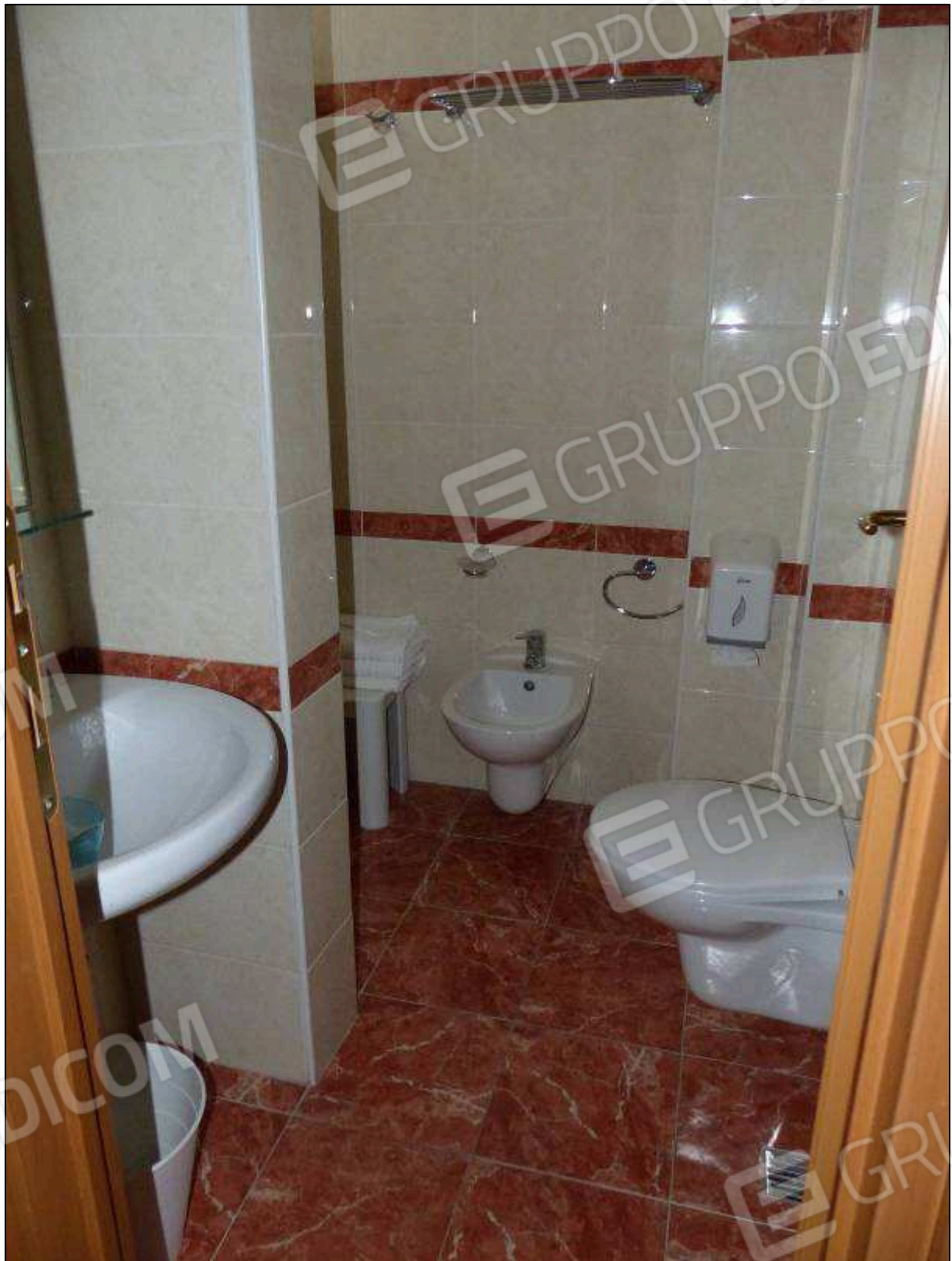
FOTO 68 – Piano primo: bagno in camera tipo dell'albergo "Hotel [REDACTED]".