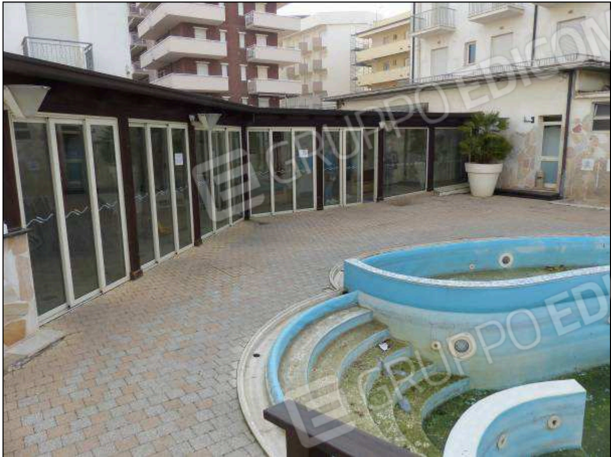
FOTO 39 – Piano terra: portico di collegamento tra gli alberghi “Hotel ██████” e “Hotel ██████”.