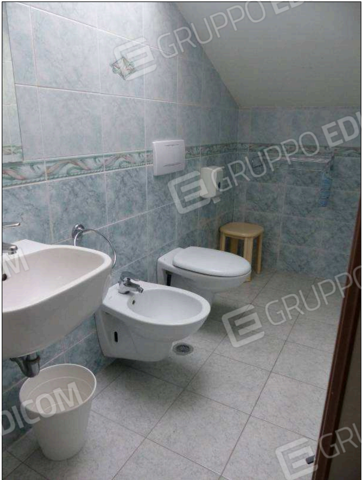
FOTO 32 - Piano sottotetto: bagno in camera tipo dell'albergo "Hotel ████████".