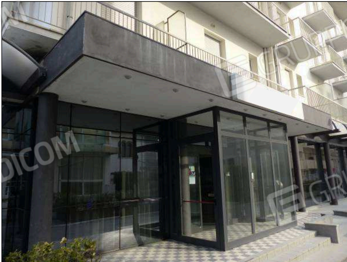
FOTO 5 – Piano terra: ingresso dell'albergo "Hotel ██████" su Via Pirano.