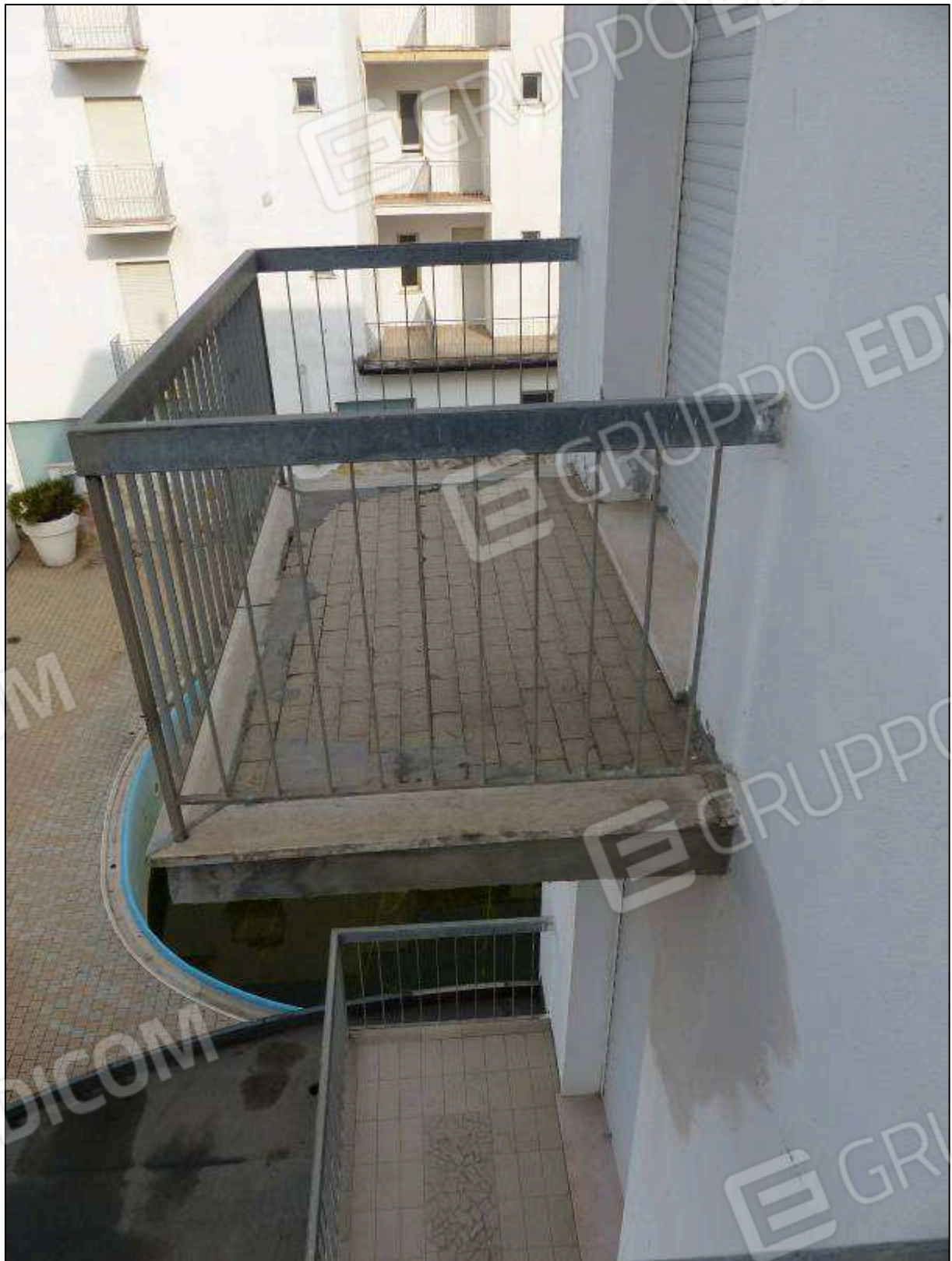
FOTO 21 - Piano secondo: balconi della camera tipo dell'albergo "Hotel [REDACTED]".