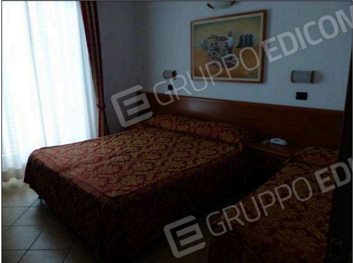
FOTO 24 - Piano terzo: camera tipo dell'albergo "Hotel ████████".