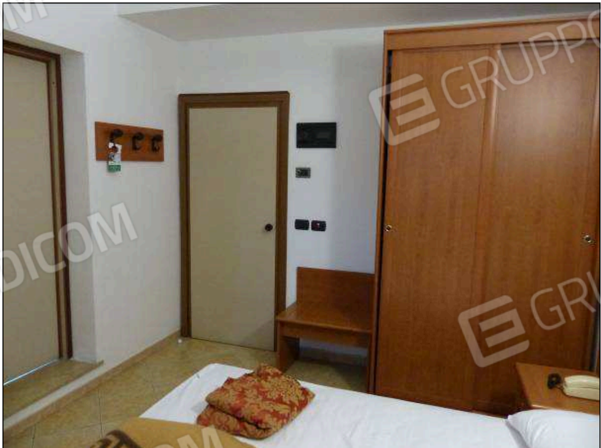
FOTO 14 – Piano primo: camera tipo dell'albergo "Hotel ████████".