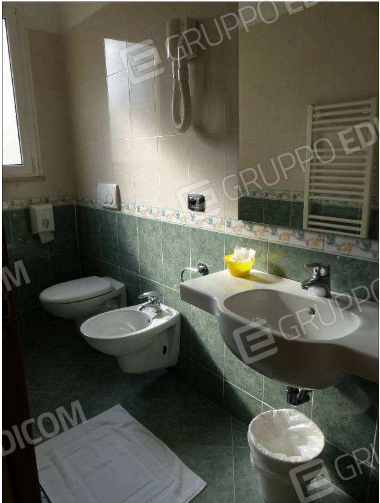
FOTO 16 – Piano primo: bagno in camera tipo dell'albergo "Hotel [REDACTED]".