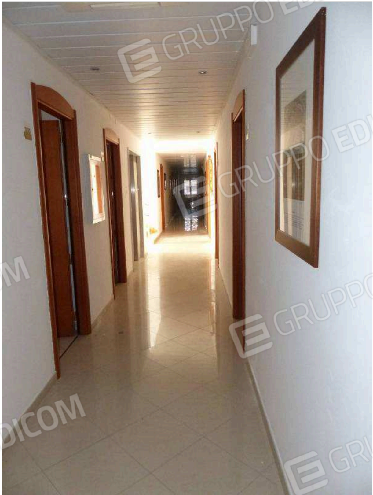
FOTO 77 – Piano quarto: corridoio di disimpegno dell'albergo "Hotel [REDACTED]".