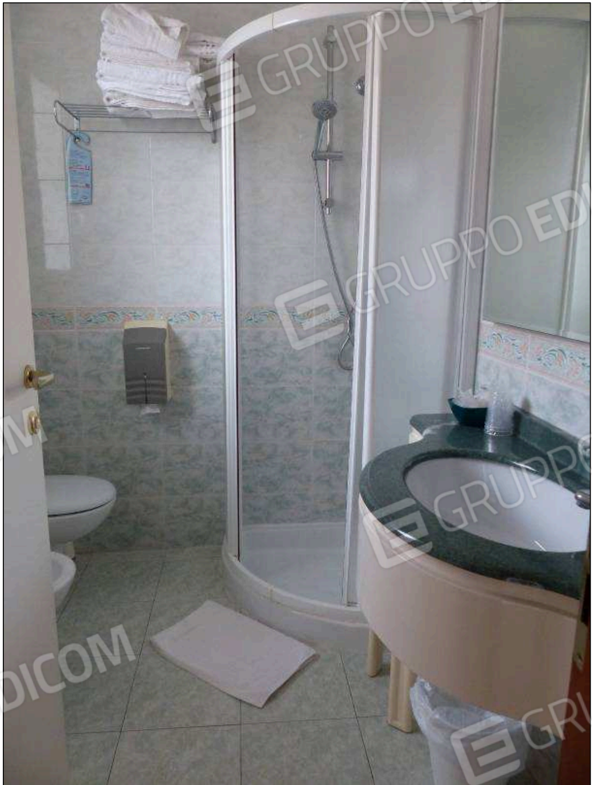
FOTO 22 – Piano secondo: bagno in camera tipo dell'albergo "Hotel [REDACTED]".