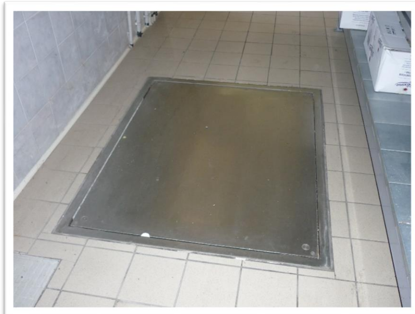
FOTOGRAMMA N. 6 - BILANCIA INTERRATA