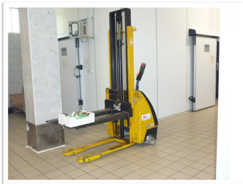
FOTOGRAMMA N. 2- ALTRA CELLA FRIGORIFERA E TRASPALLET