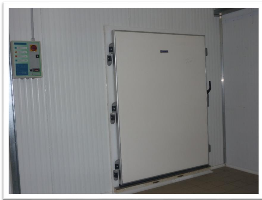
FOTOGRAMMA N. 1 - UNA DELLE CELLE FRIGORIFERE