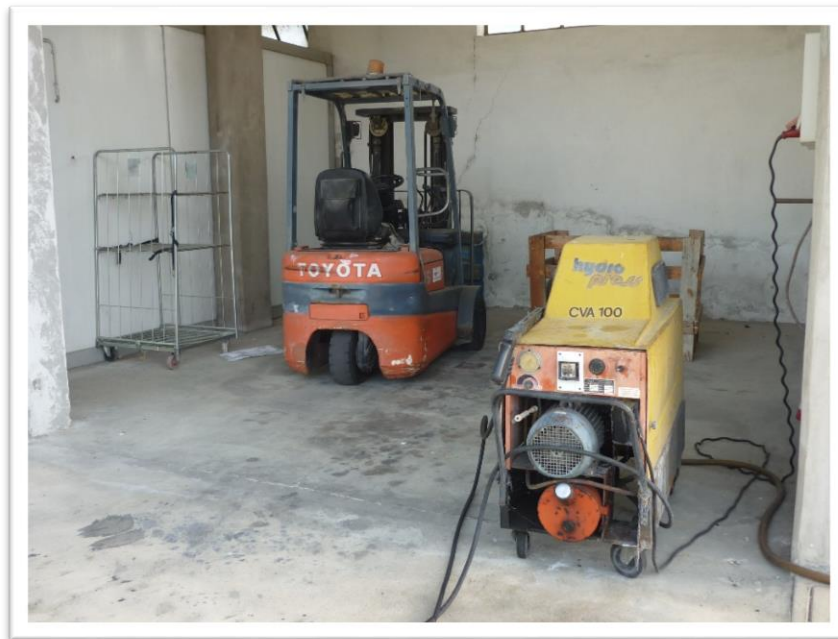
FOTOGRAMMA N.3 - MULETTO E CARICATORE