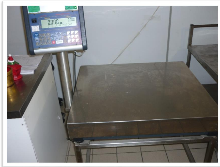
FOTOGRAMMA N. 5 - UNA DELLE BILANCE