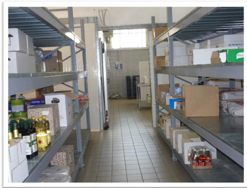
FOTOGRAMMA N. 7 - SCAFFALATURE