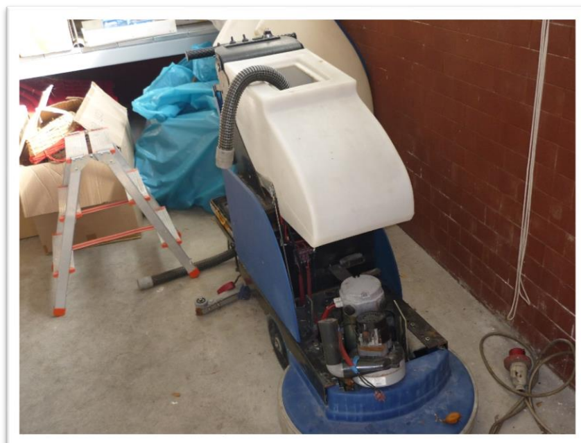
FOTOGRAMMA N. 4 -LAVA PAVIMENTI INDICATA COME GUASTA