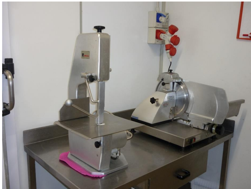
FOTOGRAMMA N. 8 -SEGA OSSA E AFFETTATRICE