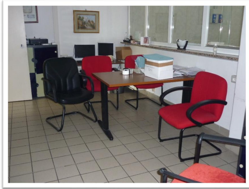
FOTOGRAMMA N. 9 - MOBILI DELL' UFFICIO