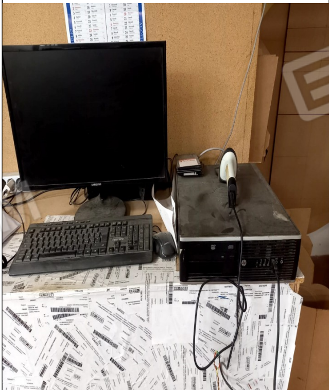
16 - COMPUTER HP DT 8300