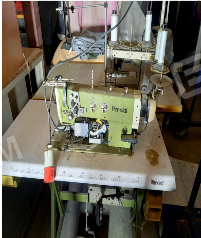
6 - 2 AGHI RIMOLDI, MOTORE CON CARTER