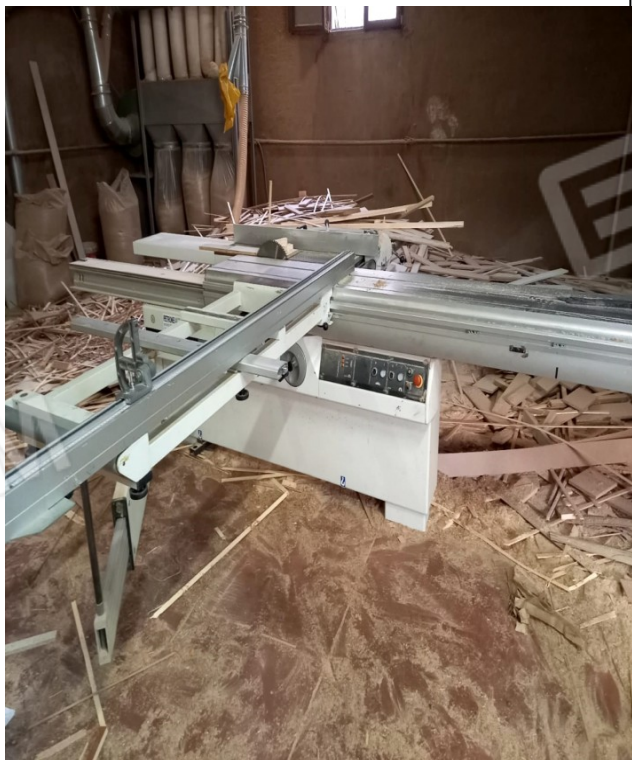
12 - SEGA CIRCOLARE SCM GROUP