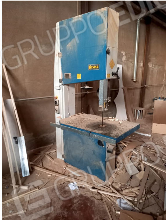
22 - SEGATRICE A NASTRO 2500SERIE IND.LE