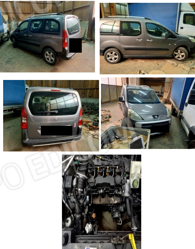
AUTOVETTURA TARGA [REDACTED]

NOTA: MACCHINA NON MARCIANTE, TURBINA MOTORE ROTTA