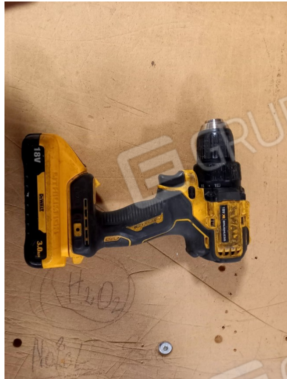
7 - TRAPANO AVVITATORE