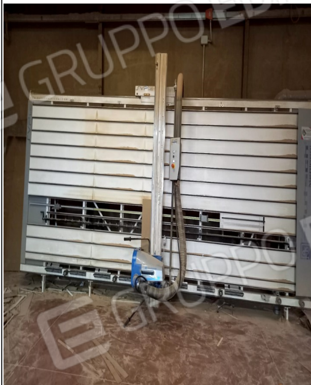
11 - SEZIONATRICE VERTICALE PER PANNELLI PUTH