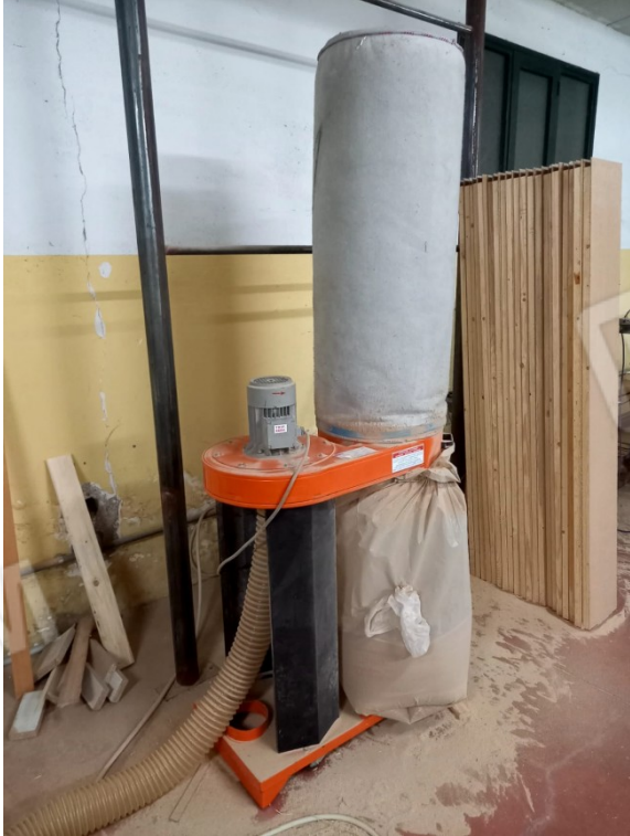
3 - ASPIRATORE USATO