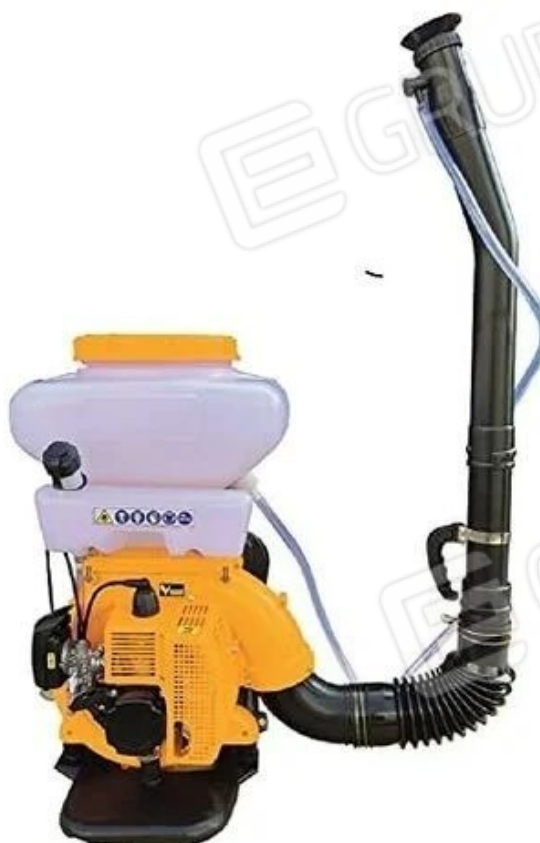
10 - AUTOMIZZATORE A SPALLA VIGOR