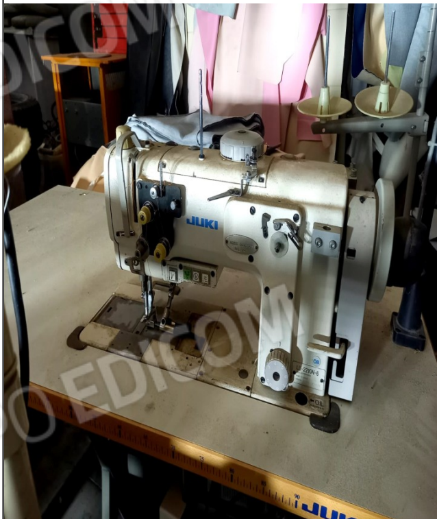
17 - MACCHINA LINEARE TRIPLICE JUKI