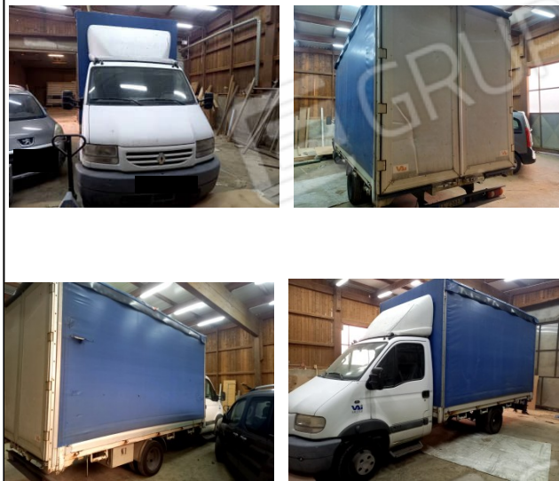
14 - CAMIONCINO TARGATO [REDACTED]

NOTA: CAMIONCINO NON MARCIANTE, CAMBIO DIFFERENZIALE ROTTO