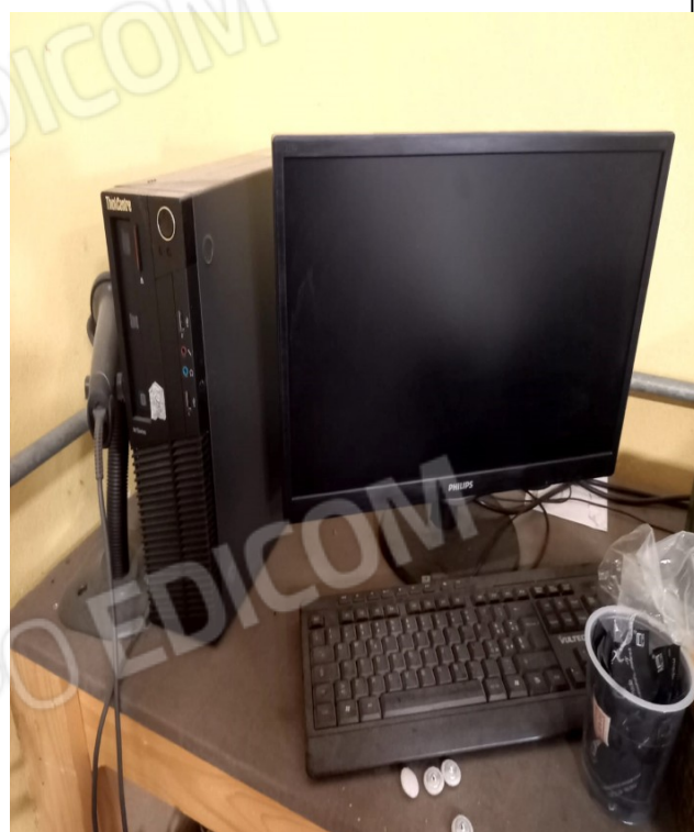
18 - LENOVO PC + PHILIPS MONITOR