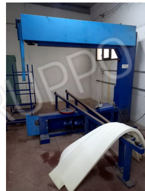
9 - TAGLIERINA SMONTATA