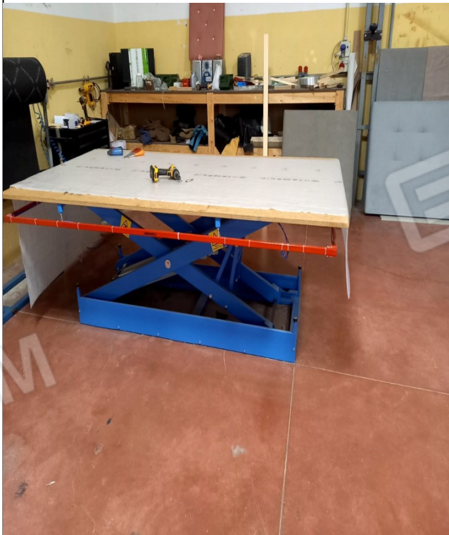
24 - BANCO PNEUMATICO MOD. "BP/800S"