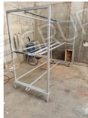
13 - DISPOSITIVO PEZZI + APPOGGI SCORREVOLI