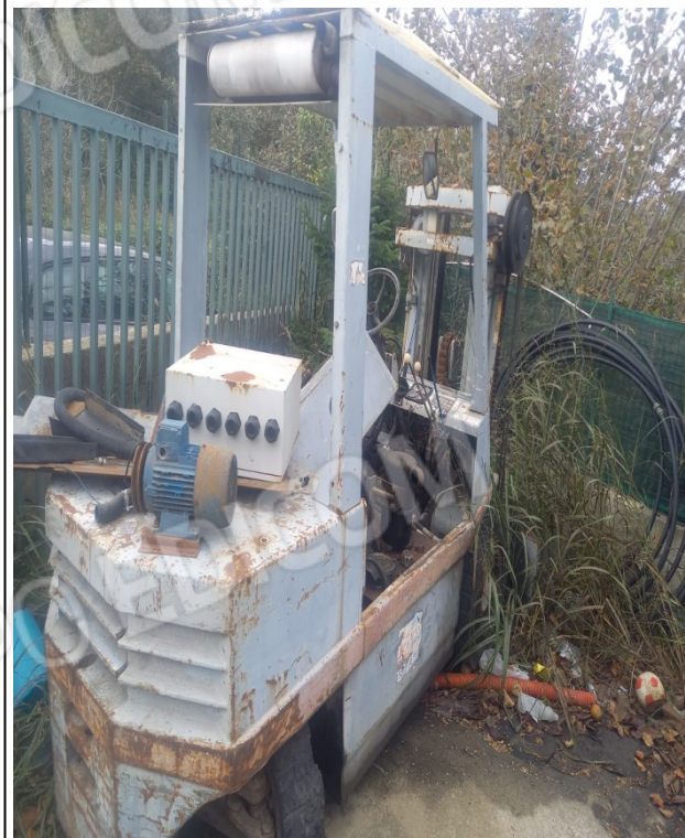
8 - MULETTO CM 50 USATO