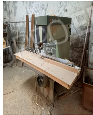
9 - PANTOGRAFO