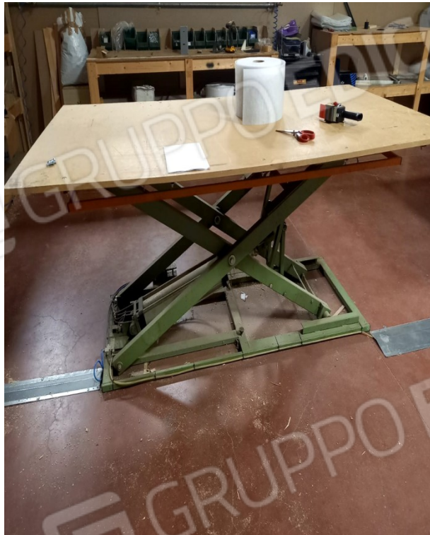
19 - BANCHI PNEUMATICI MODELLO BIEMME