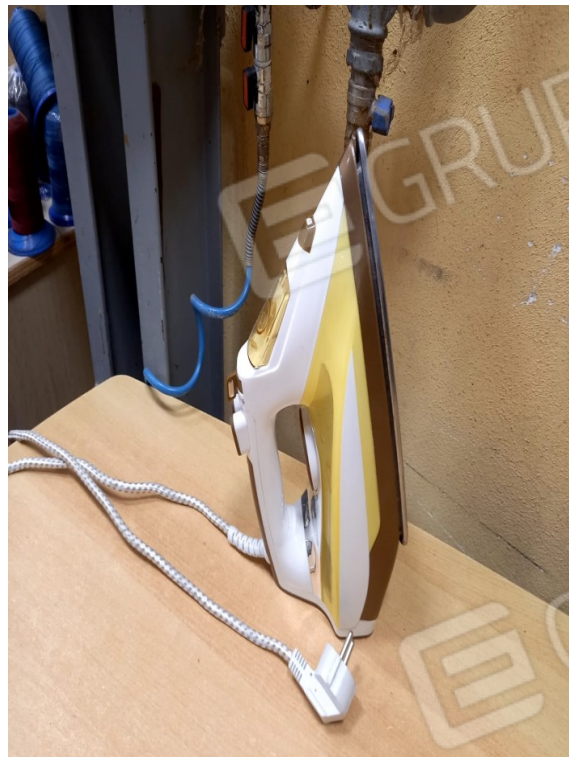
4 - FERRO DA STIRO