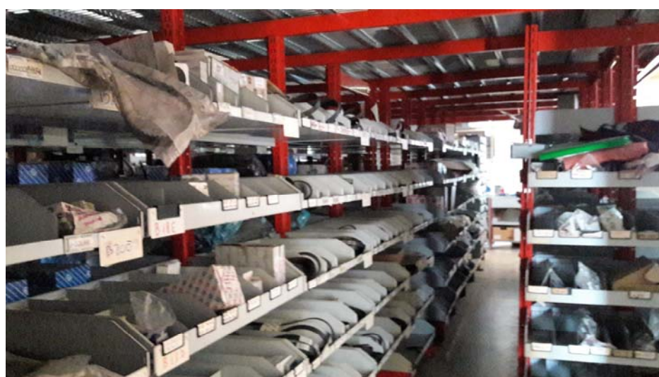
Foto1, 2, 3 : Magazzino